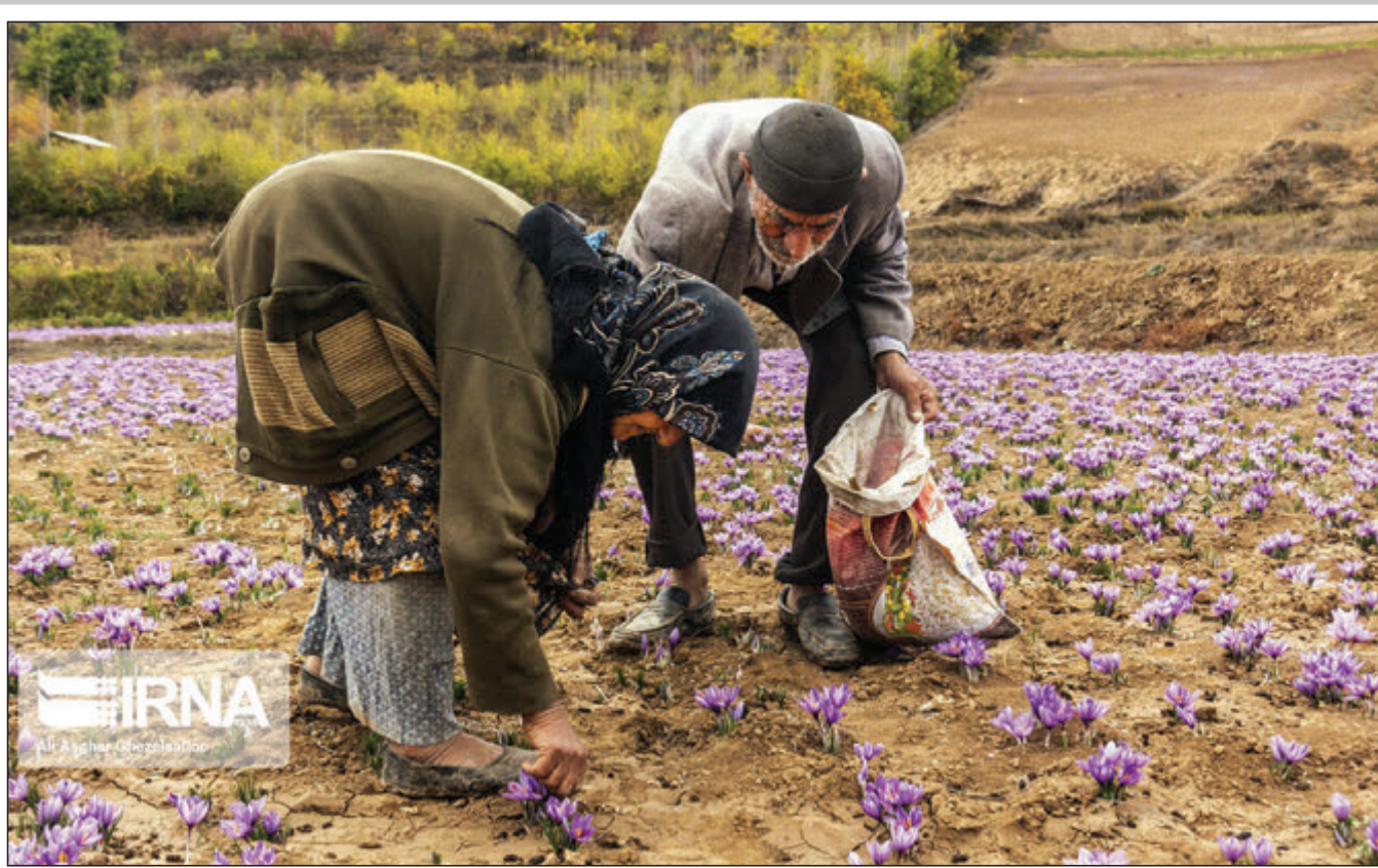
شرایط خرید حمایتی زعفران از سوی دولت