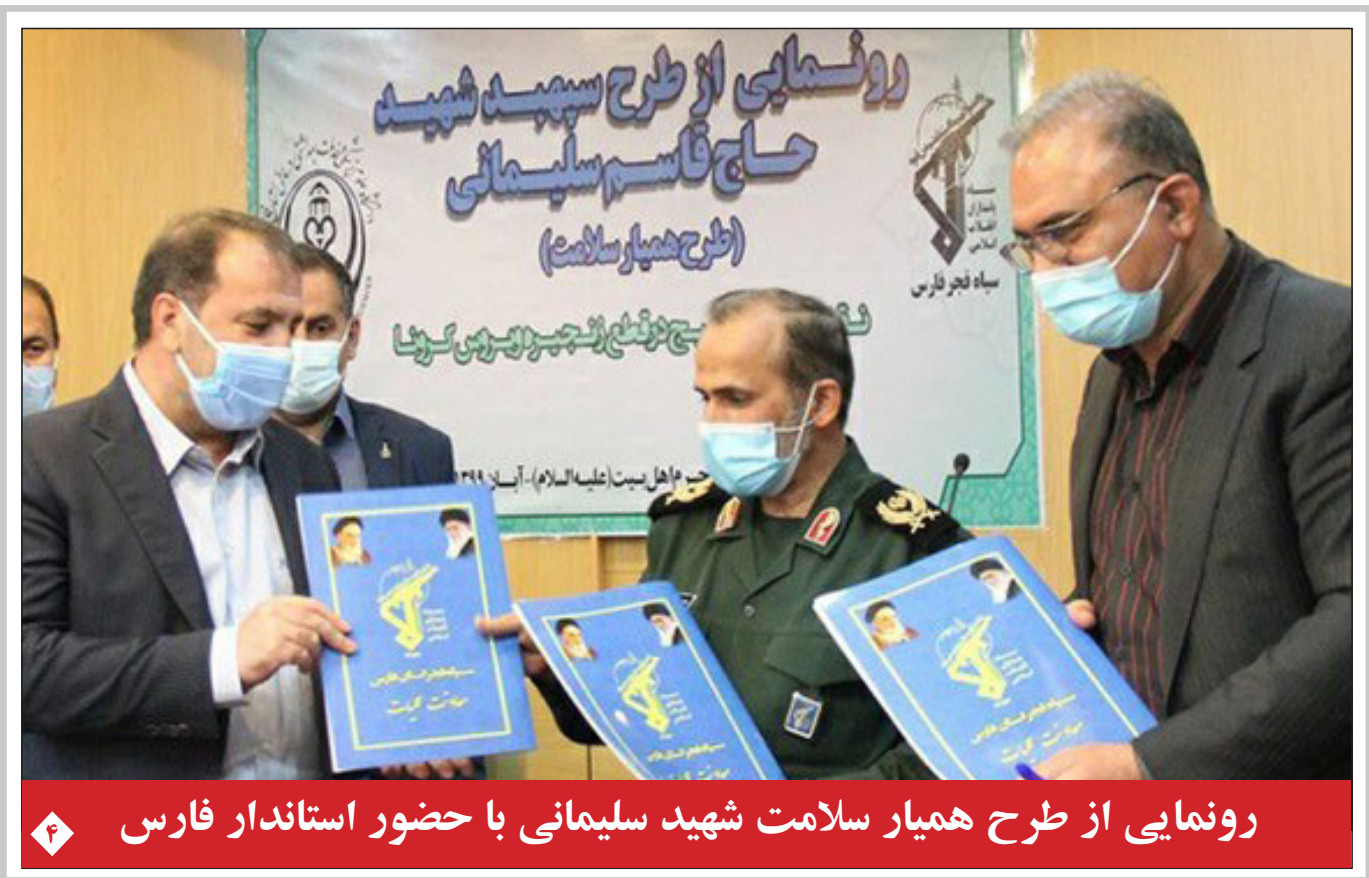
رونمایی از طرح همیار سلامت شهید سلیمانی با حضور استاندار فارس