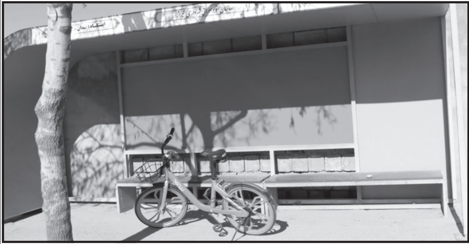
نیود، پارکیتهی به بزرگی شیراز