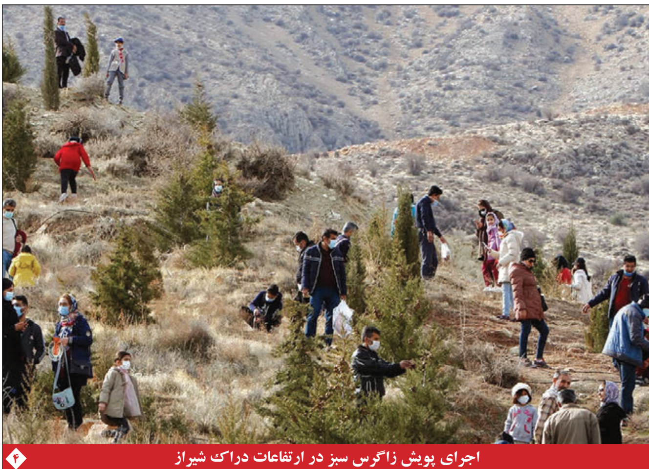
اجرای پویش زاگرس سبز در ارتفاعات دراک شیراز