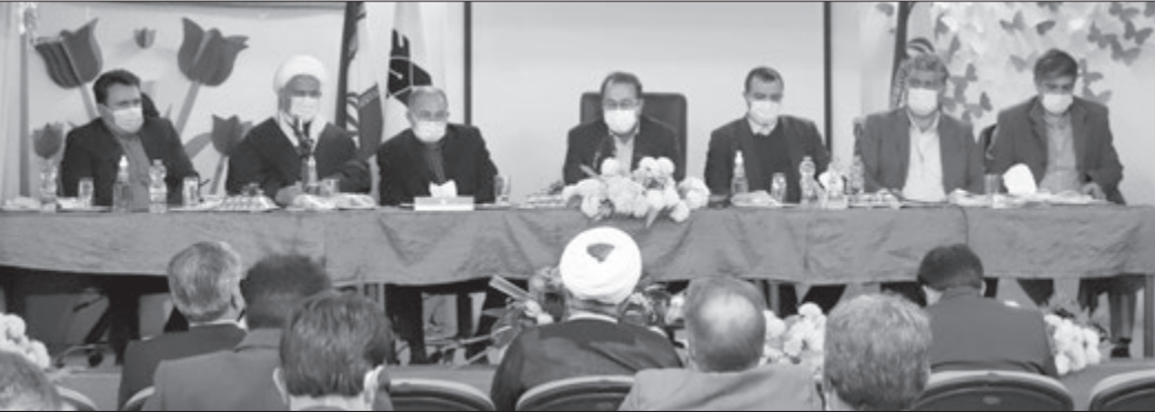
حجت‌الاسلام علیرضا رحیمی استاندار فارس

آینده کشور و منافع ملی در گرو برگزاری انتخاباتی باشکوه است