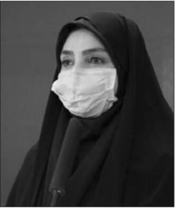
یک زن در حال پوشیدن ماسک در یک مرکز درمانی در تهران.