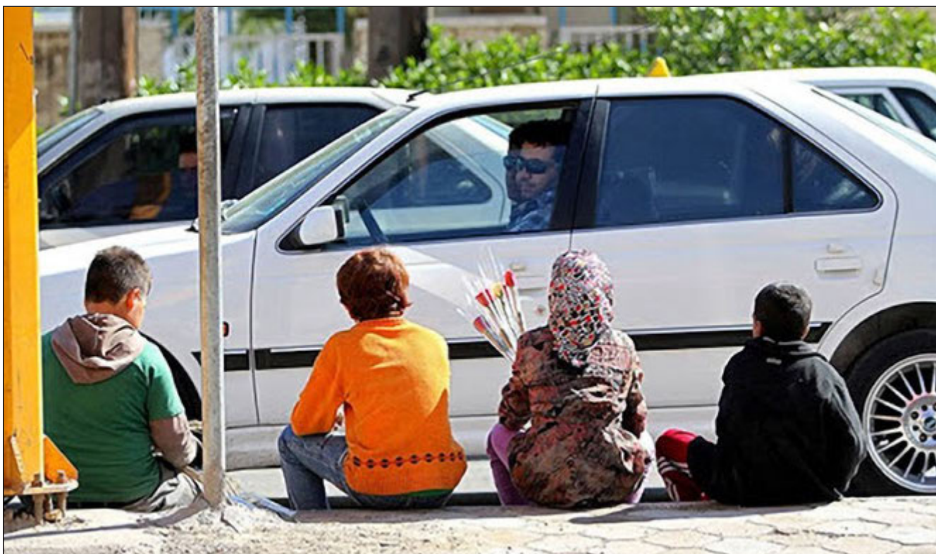
مدیرکل بهزیستی فارس: مردم کمک‌هایشان را به کودکان کار در جهت توانمندی آنها هزینه کنند

۱ هشدار رئیس جمهوری درباره کاهش مراعات پروتکل‌های بهداشتی در کشور ظریف: به دنبال ایجاد کریدور اتصال خلیج فارس به روسیه و دریای سیاه هستیم یکی از مقامات مالی چین به اتهام دریافت رشوه اعدام شد بایدن قول داد «با اخلاق‌ترین دولت» را داشته باشد ۲ کارشناس اقتصادی: عدم تصویب FATF هزینه مبادلات اقتصادی ایران را بالا برده است در کارگروه توسعه صادرات استان تاکید شد تبیین نقش راهبردی حمل و نقل ریلی در افزایش صادرات ۱۰