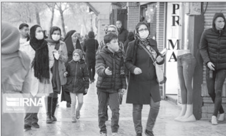
او اضافه کرد: تاکنون ۱۶۲ هزار و ۸۶۶ بیمار کووید ۱۹ نیز با بهبودی کامل از بیمارستان‌ها مرخص یا از ایزوله خانگی خانگی خارج شده‌اند. معاون بهداشت دانشگاه با ابراز تأسف جان باختن