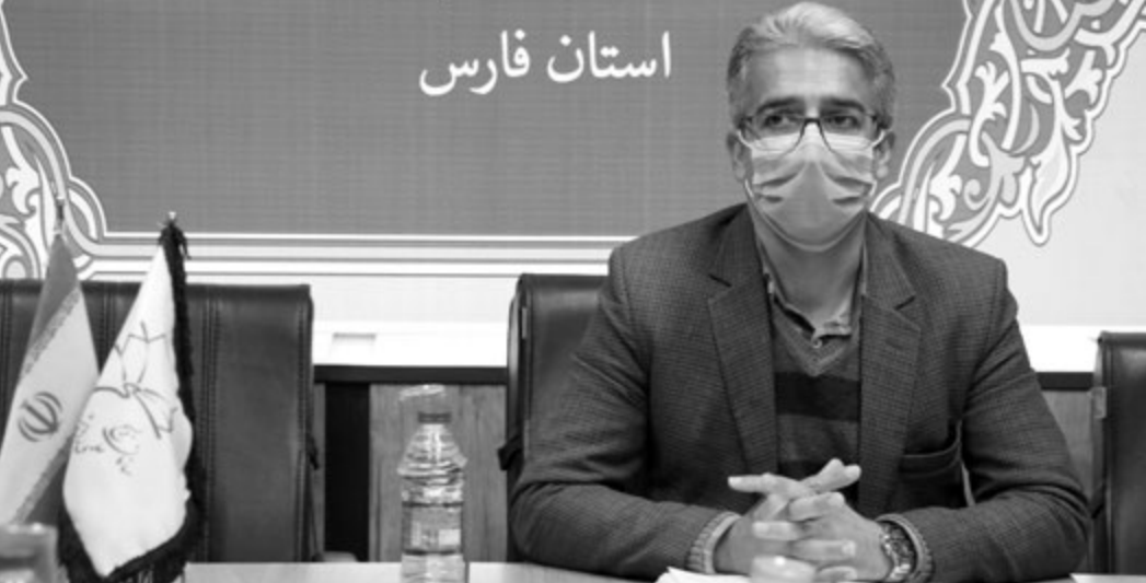
مدیر کل دیوان محاسبات فارس

مردودشت، محمدرسول الله (ص) و قیروکارزین، قردرانی از خانواده یک شهید مدافع سلامت را از دیگر برنامه های جشنواره جهادگران اعلام کرد. قاسمی همچنین از افتتاح اولین مرکز نوآوری در جنوب کشور و در فارس در سال ۱۴۰۰ خبر داد و گفت: در دهه فجر امسال برنامه هایی نظیر