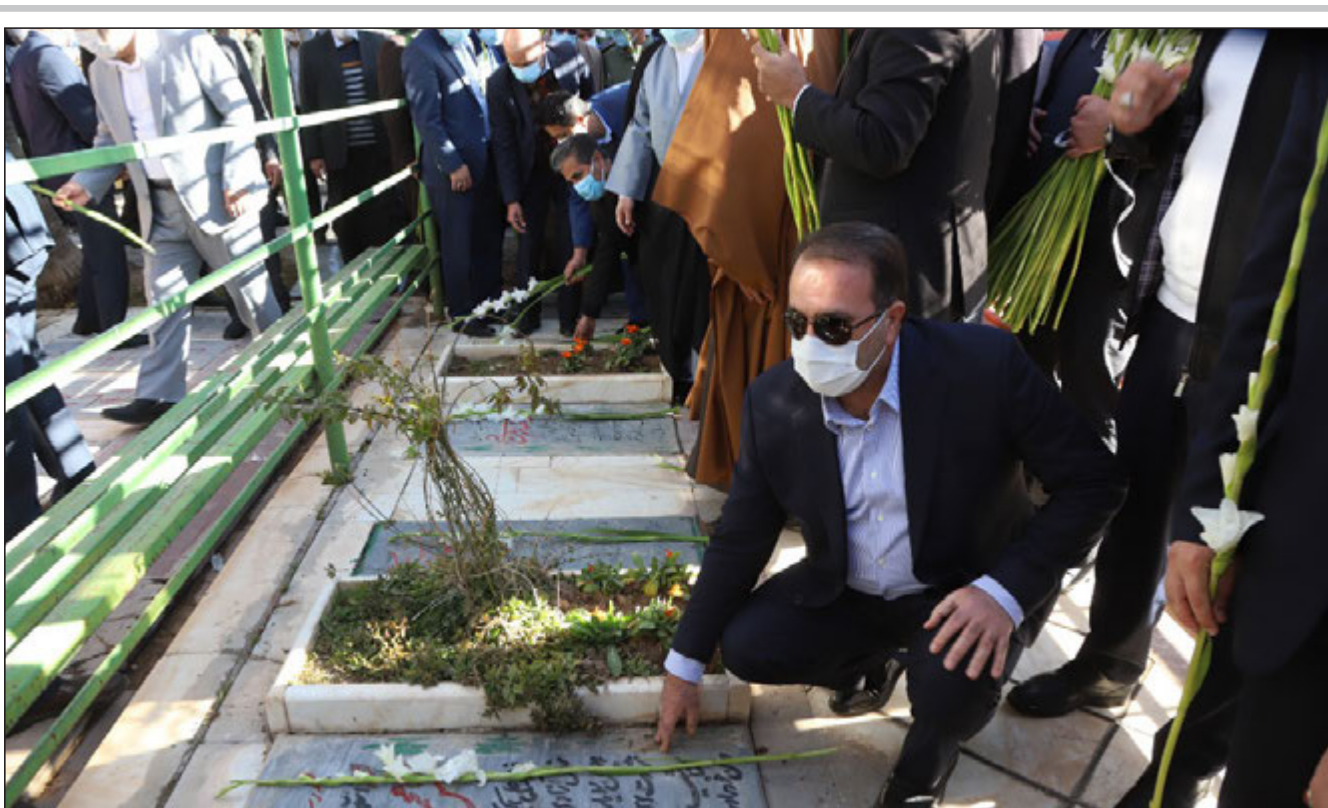
ادای احترام مدیران ارشد فارس به مقام شامخ شهدا