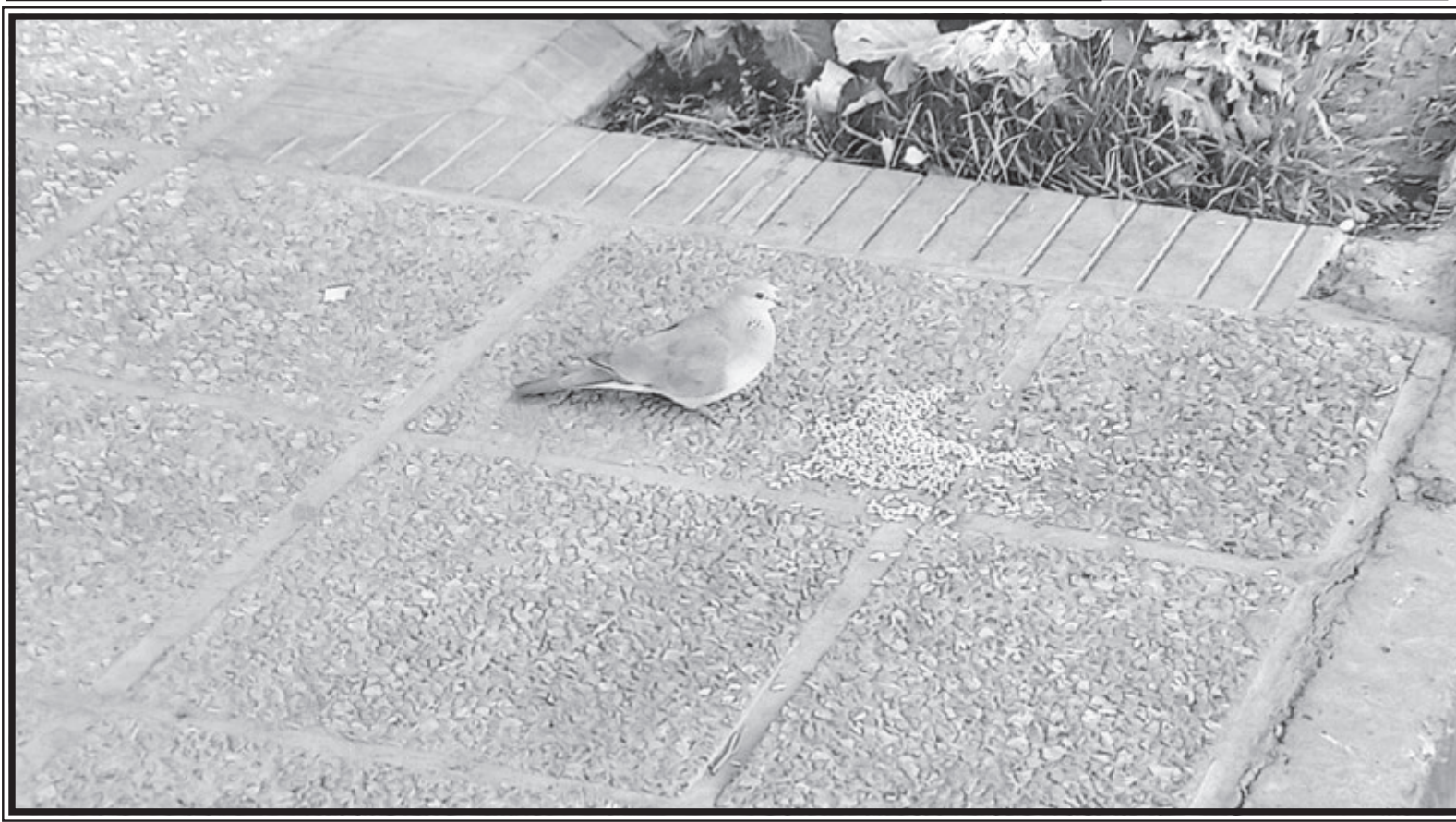
برندهای را برای عبور از زمستان با مثنی دانه یاری کنیم