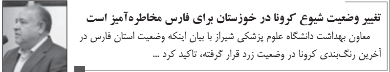
تغییر وضعیت شیوع کرونا در خوزستان برای فارس مخاطره‌آمیز است ماون بهداشت دانشگاه علوم پزشکی شیراز با بیان اینکه وضعیت استان فارس در آخرین رنگ‌بندی کرونا در وضعیت زرد قرار گرفته، تاکید کرد ...