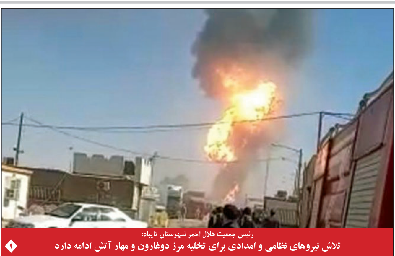
رئیس جمعیت هلال احمر شهرستان تایباد: تلاش نیروهای نظامی و امدادی برای تخلیه مرز دوغارون و مهار آتش ادامه دارد