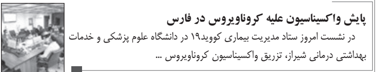
پایش واکسیناسیون علیه کروناویروس در فارس در نشست امروز ستاد مدیریت بیماری کووید۱۹ در دانشگاه علوم پزشکی و خدمات بهداشتی درمانی شیراز، تزریق واکسیناسیون کروناویروس ...

یادداشت خبرنگار telegram.me/safardavam سفردوام/عصر مردم