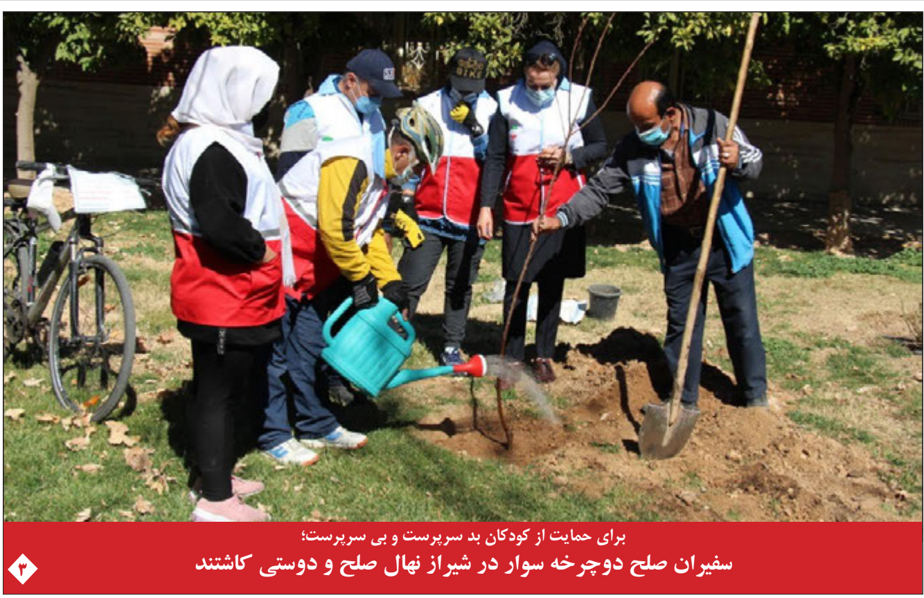
برای حمایت از کودکان بد سرپرست و بی سرپرست؛ سفیران صلح دوچرخه سوار در شیراز نهال صلح و دوستی کاشتند