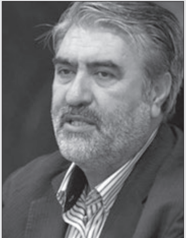
شود که حتی در بیمه تکمیلی هم این روند دیده شده