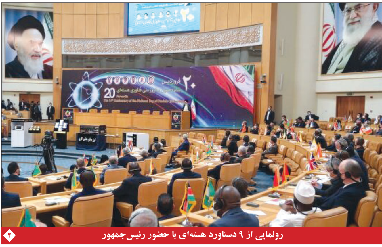
رونمایی از ۹ دستاورد هسته‌ای با حضور رئیس‌جمهور

ادعای یک سناتور آمریکایی درباره احتمال حذف نام «سپاه» از فهرست گروه‌های تروریستی توسط بایدن ژنرال روس، با تجربه جنگ در سوریه، مسوول جنگ اوکراین شد روایت مالکی از جلسه ای درباره برجام در مسکو وزارت خارجه روسیه: ناتو درگیر جنگ نیابتی علیه مسکو است امیر دریادار ایرانی: حضور نظامی کشورهای غیردوست در آب‌های اقیانوسی منطقه توجیه ندارد اذعان پمپئو: سردار سلیمانی سد راه سازش اعراب و اسرائیل بود