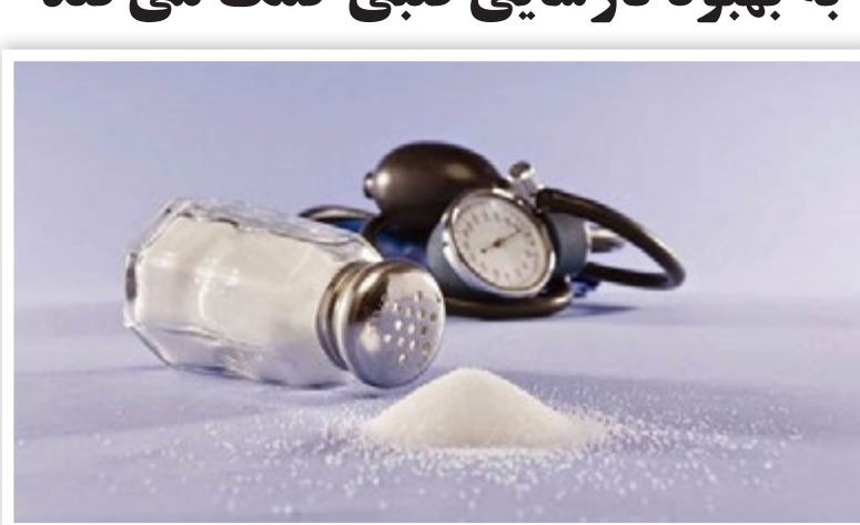
بیشتر نمک دریافتی در رژیم غذایی دریافت کردند. باز داده شد و تشویق شدند که در خانه غذا بپزند و نمک اضافه نکنند. همچنین از آنها خواسته شد از

مهر: تحقیقات جدید نشان می‌دهد کاهش مصرف نمک اگرچه از مرگ یا بستری شدن در بیمارستان در بین بیماران قلبی جلوگیری نمی‌کند، اما به نظر می‌رسد کیفیت زندگی آنها را بهبود می‌بخشد.