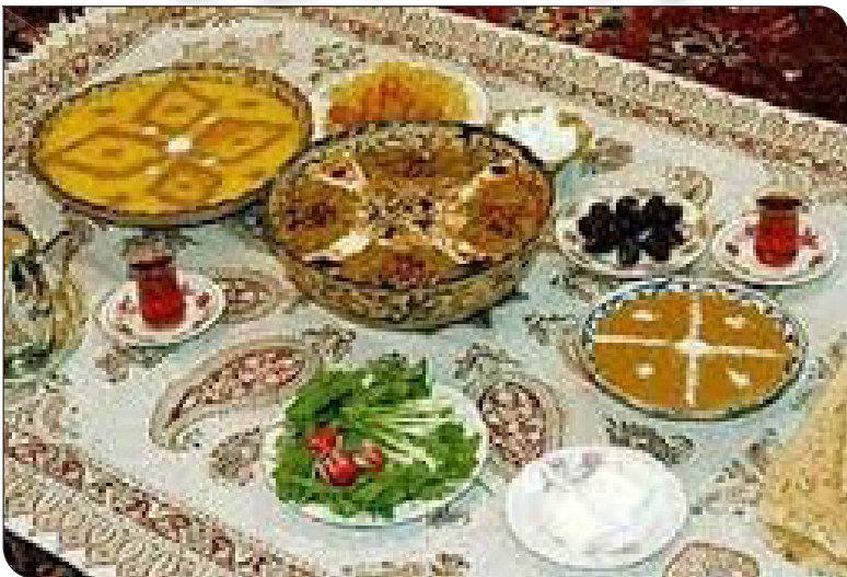
ضعف در بدن می‌شود.

مده اجتناب شود و زمان استراحت را به بعد از ظهر موکول کنند.