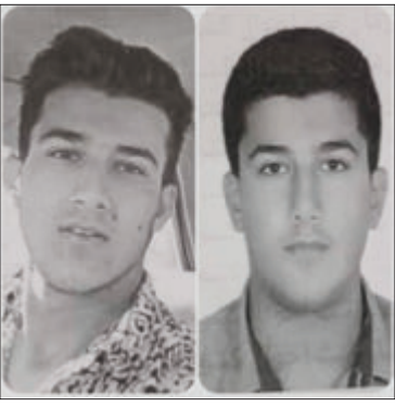
متهمان به قتل صادق عابدی فرزند عبدالرحیم هستند.

تصاویر متهمان در راستای احقاق عدالت منتشر شده است.