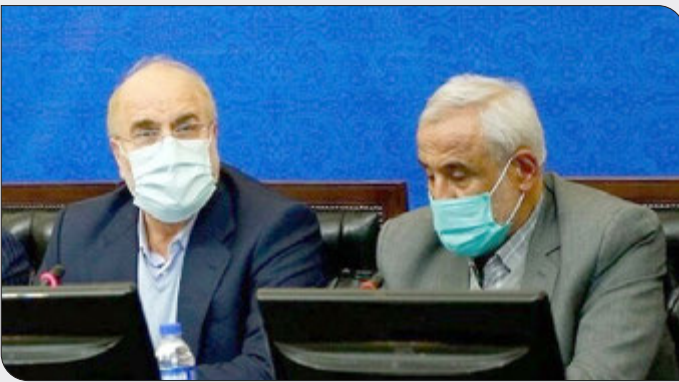
سخنگوی فراکسیون انقلاب اسلامی مجلس عمومی، صبح چهارشنبه در اختیار سخن علنی مجلس قرار می‌گیرد.