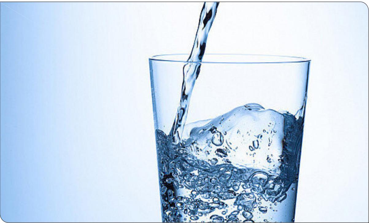
نوشیدن آب به بدن انرژی می‌دهد.

می‌شود یا به عبارتی فرد کمتر در مورد نیاز به مصرف آب هوشیار است. از این رو، افراد سالمند اغلب فراموش می‌کنند به اندازه کافی آب بنوشند. کاهش مصرف آب در گروه های سنی بالاتر می‌تواند به سرگیجه، اختلالات هوشیاری یا بیهوشی منجر شود و حتی در موارد کم آبی شدید باید به فرد سرم تزریق شود.