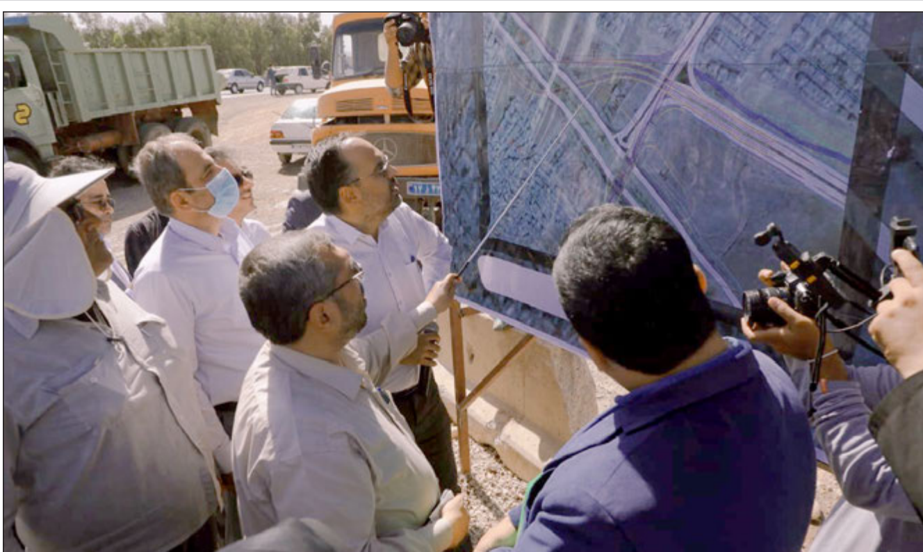
شهردار اعلام کرد: اجرای ۱۸ پروژه بزرگ شهری در شیراز

دیگر امکان تامین ارز واردات کالاهای اساسی را نداریم