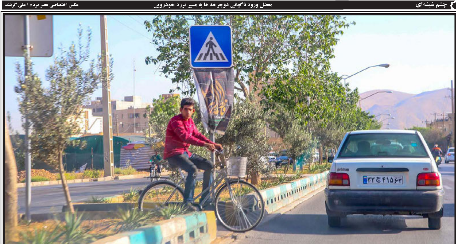
معتزل ورود نا ناگهانی دوچرخه‌ها به مسیر تردد خودرویی