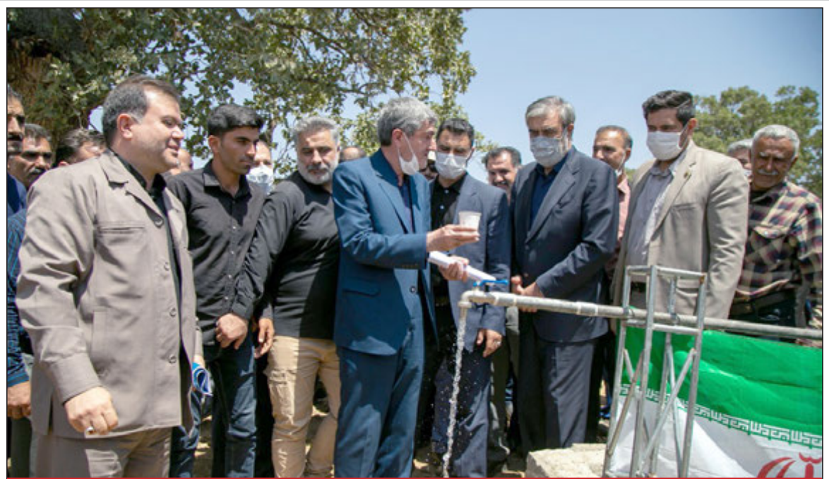
گام بلند شرکت آب و فاضلاب شهرستان شیراز برای آبرسانی به روستاهای دهستان کوهمره سرخی