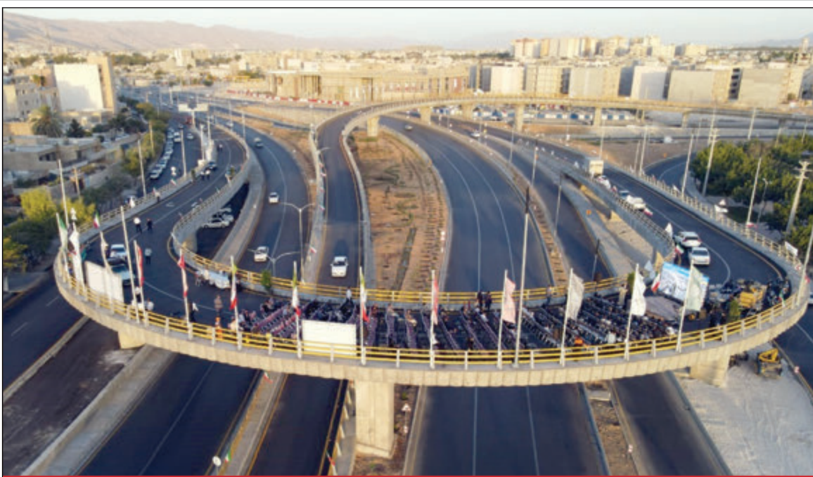
با حضور معاون اقتصادی رئیس‌جمهور انجام شد؛ بهره‌برداری از تقاطع چندسطحی مدافعان سلامت در شیراز