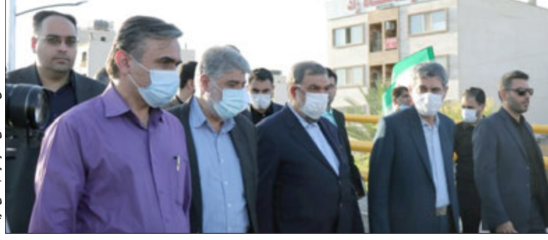
معاون اقتصادی رئیس‌جمهور، استاندار فارس، رئیس و جمعی از اعضای شورای اسلامی شهر شیراز، سرپرست شهرداری شیراز و با حضور جمعی از مدیران استانی و شهری به بهره‌برداری رسید.