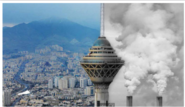
آلودگی هوا به زنان بیش از مردان آسیب می‌رساند.