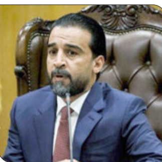
به دنبال دعوت طرف‌های سیاسی به دور دوم گفت‌وگوی ملی توسط نخست‌وزیر عراق، رئیس پارلمان این کشور شروطی را برای انجام این گفت‌وگو مطرح کرد.

به گزارش ایسنا، به نقل از شفق نیوز، محمد الحلیوسی، رئیس پارلمان عراق در توییتی نوشت: دستور کار جلسات گفت‌وگوی ملی آتی باید شامل مواردی باشد که روند سیاسی بدون توافق بر سر آن‌ها نمی‌تواند پیش برود.