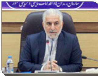
غلامعلی محمدی رئیس سازمان زندان‌ها در این نشست و پس از ارائه گزارشی توسط مدیران این دفتر گفت: یکی از اولویت‌های ما تمرکز بر لکترونیک» با حضور دکتر غلامعلی محمدی درمحل ستاد این سازمان برگزار شد.

هر تخلفی از مقررات پابند لکترونیک، منجر به بازگشت به زندان می‌شود وی با بیان اینکه درصدد هستیم تمام زندانیان واجد شرایط را زیرپوشش پابند لکترونیک قرار دهیم، گفت: نظرات ما بر این تأسیس کیفری که قاعده رحمت نظام کیفری نظام جمهوری اسلامی ایران است، از این پس جدی‌تر گرفته می‌شود و البته در حوزه نظارت نیز باید شاهد