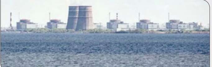
نیروگاه زاپوریژیا اوکراین بار دیگر از شبکه اصلی برق این کشور خارج شد. اتفاقی که موجب تشدید نگرانی‌ها در میان نبرد انرژی بین مسکو و غرب شده است.

بزرگاری انتخابات زودهنگام پارلمانی حداکثر تا