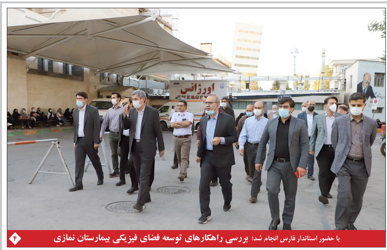
با حضور استاندار فارس انجام شد: بررسی راهکارهای توسعه فضای فیزیکی بیمارستان نمازی