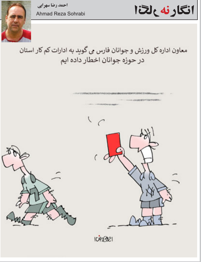
نگارنده: محمدرضا سهرابی

ایرنا: مدیرکل میراث فرهنگی استان فارس با بیان اینکه