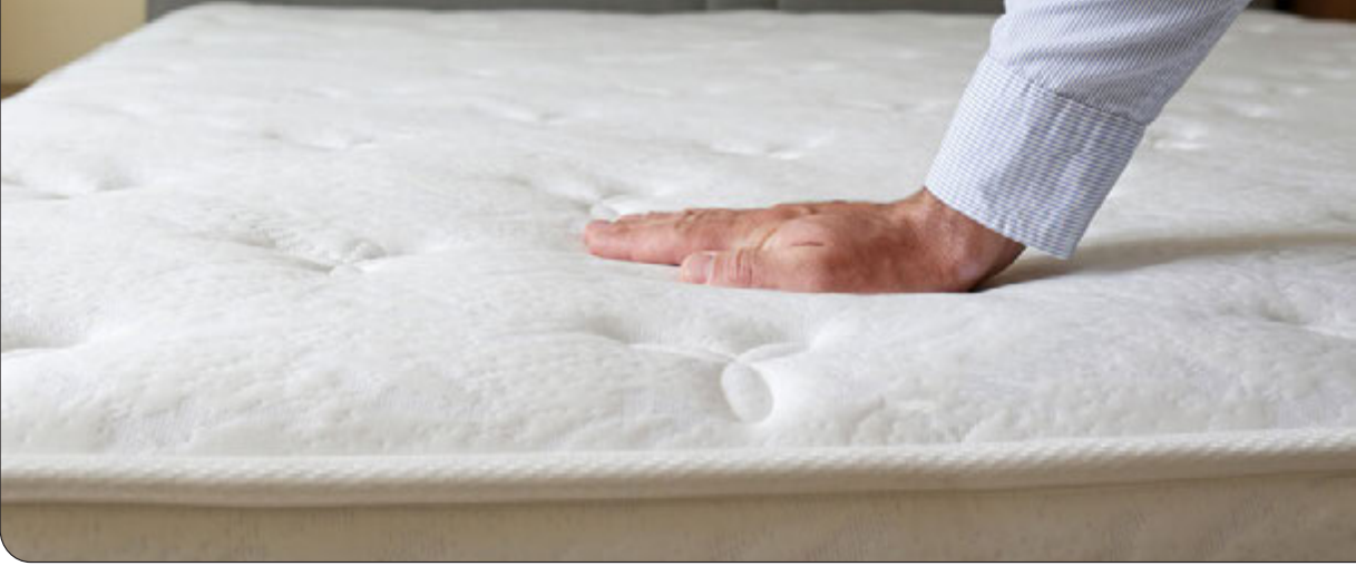
تشک‌های طبی با ویژگی‌های خاص برای رفع مشکلات خواب طراحی شده‌اند.

مناسب در نظر بگیرید این است که آیا به طور کلی کمردرد دارید یا نه، و اینکه اغلب چه مدلی می‌خواهید. آن‌هایی که کمردرد ندارند و کسالی