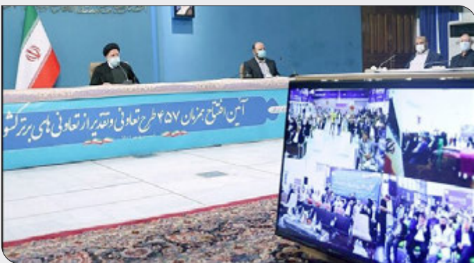
کاستی‌های اجرایی سند ملی تعاون رئیس جمهور افزود: همچنین معاونت تعاون وزارت کار نیز ۱۵ روز زمان خواهد داشت تا این تعیین فرصت زمانی یک ماهه برای رفع

رئیس جمهور با تأکید بر ضرورت افزایش نقش بخش تعاونی در اقتصاد کشور، دستگاه‌های اجرایی دارای مسئولیت در حوزه تعاون را مکلف کرد. حد اکثر در یک ماه آینده، گزارشی از دلایل کاستی‌های موجود در اجرای سند ملی تعاون و راهکارهای تحقق کامل اهداف این سند ارائه کند.