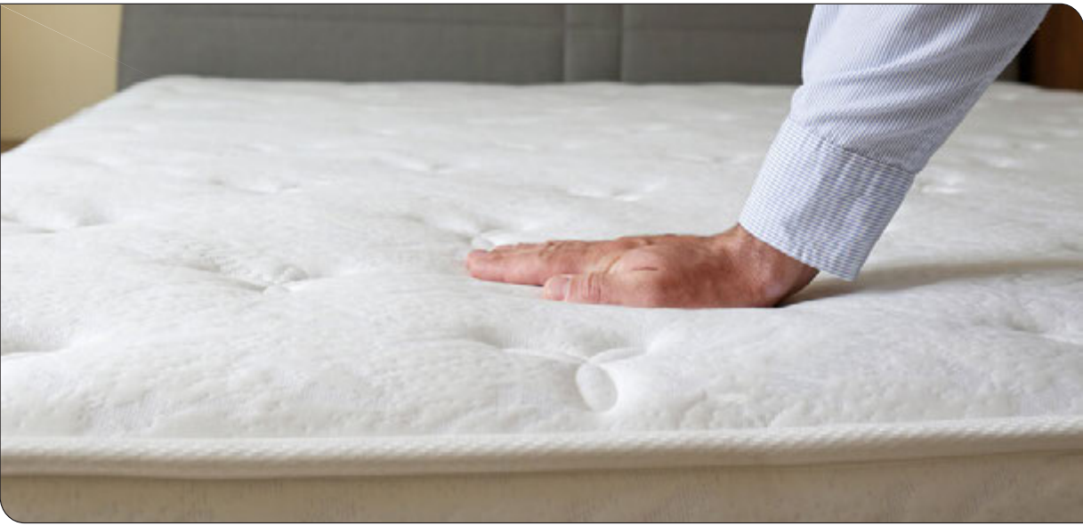
تشک‌های طبی با ویژگی‌های خاص برای رفع مشکلات خواب طراحی شده‌اند.

معنی است که وزن بدنتان به طور یکنواخت پخش می‌شود که باعث می‌شود هیچ قسمتی از بدن، فشار یا وزن بیشتری را تحمل نکند.