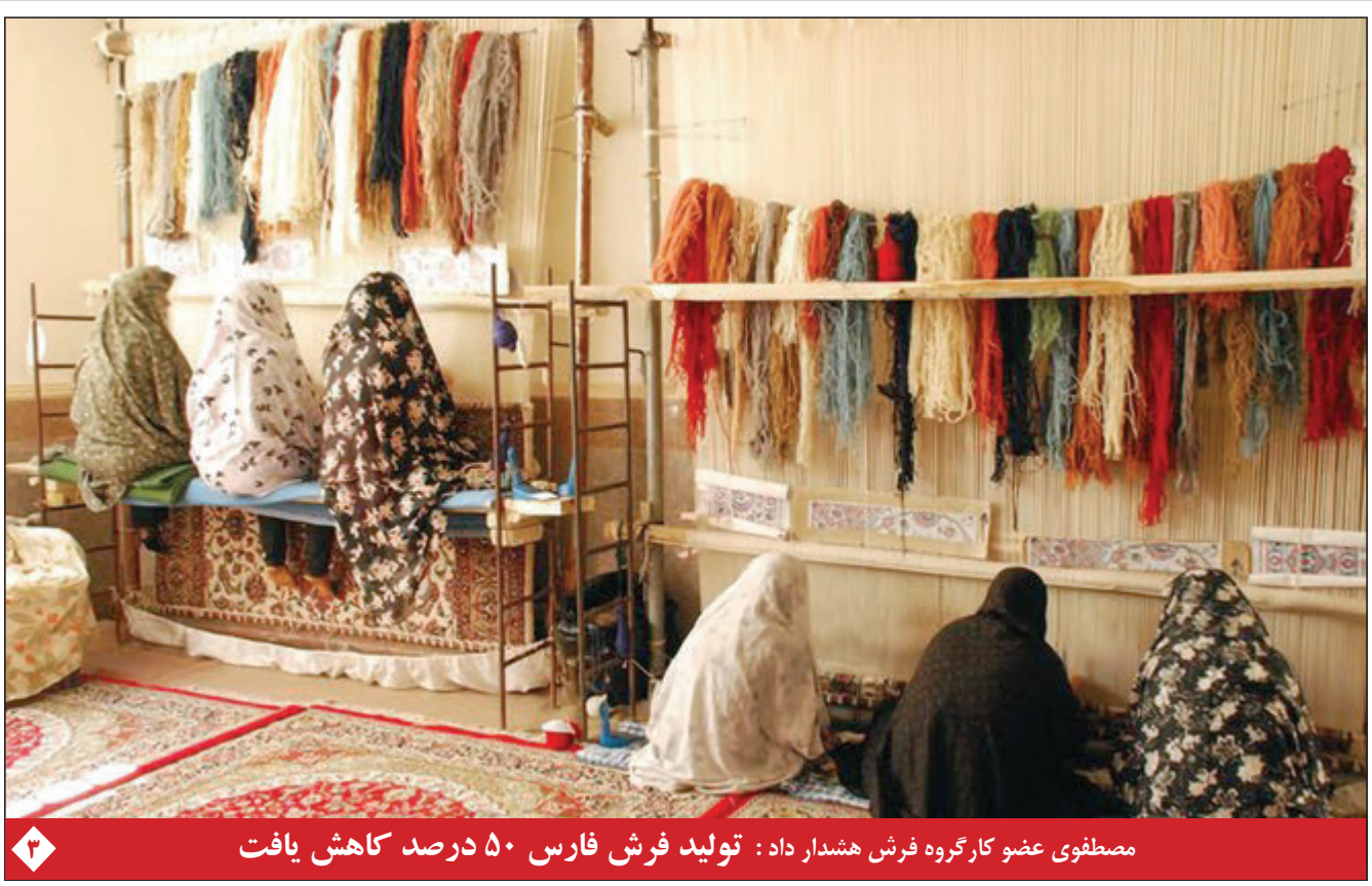
مصطفوی عضو کارگروه فرش همداد داد: تولید فرش فارس ۵۰ درصد کاهش یافت