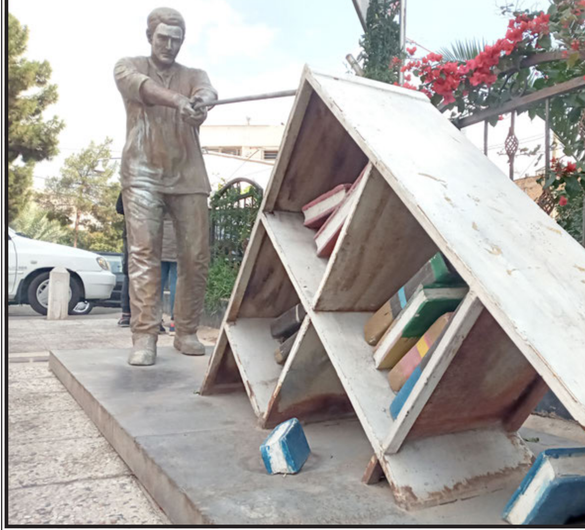
کتاب را به روز کتاب و کتابخوانی منحصر نکنیم