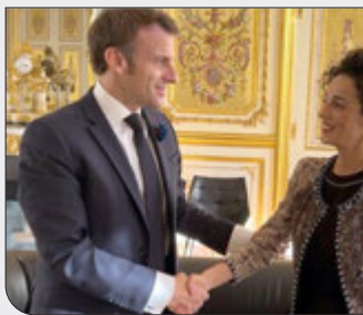
یک کارشناس ارشد روابط بین‌الملل گفت: جا دارد دستگاه دیپلماسی کشور در اقدامی هماهنگ با سه همسایه خود نسبت به اقدام نامتعارف اخیر رییس‌جمهور فرانسه اعتراض کنند.