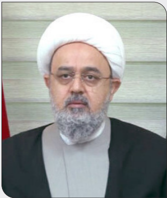
خود را به توقف عادی سازی روابط با رژیم صهیونیستی نصیحت کنند.

دبیرکل مجمع تقریب مذاهب اسلامی ضمن استقبال از طرح شیخ الازهر برای برگزاری گفت‌وگوهای اسلامی-اسلامی از وی دعوت کرد تا به ایران بیاید.