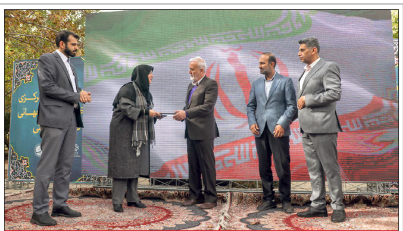
شهردار شیراز مطرح کرد: عنوان دبیرخانه شهر جهانی صنایع دستی شیراز منتج به جهش در رشد داخلی و صادرات آن شود