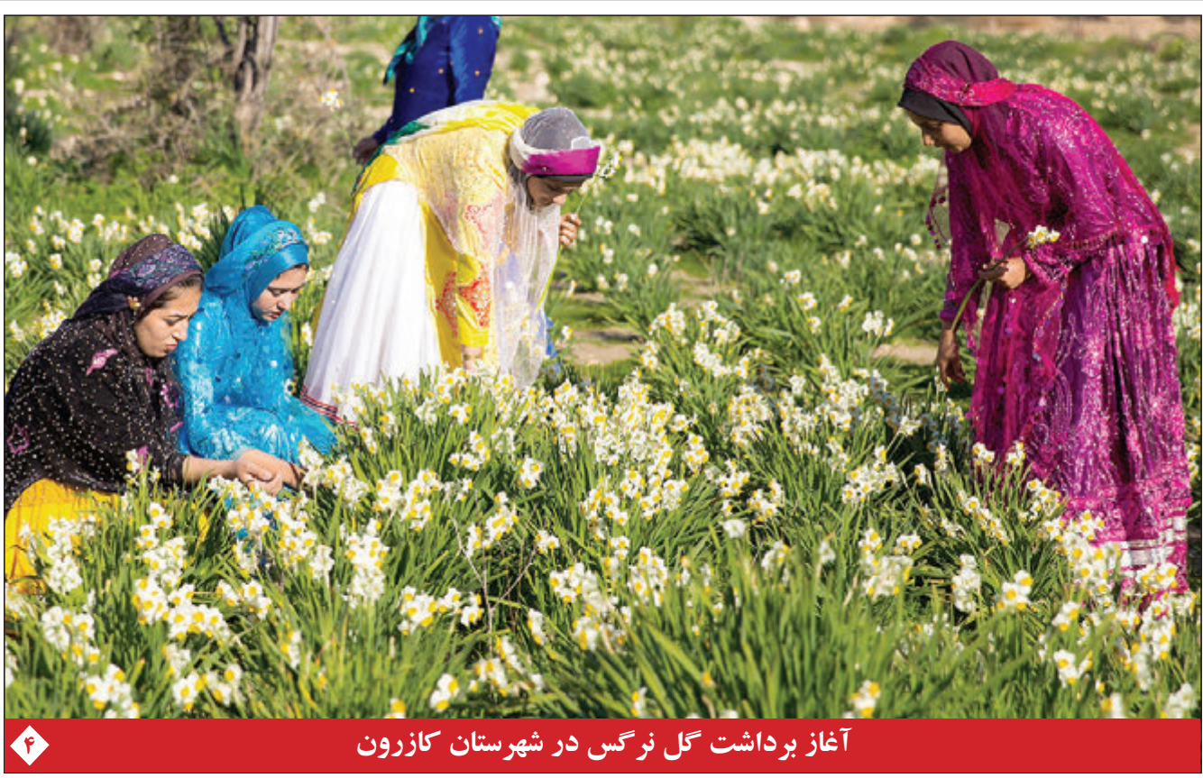
آغاز برداشت گل نرگس در شهرستان کازرون