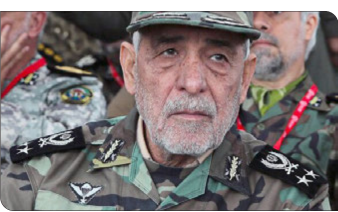
شرایط را به یاد ندارم، نیروی زمینی به بهترین شکل مأموریت محوله را انجام داد.

سرلشکر حسنی سعدی در پایان بیان کرد: جای شکر دارد که ارتش بتواند در یک چنین شرایطی توانمندی خودش را از هر لحاظ ارائه کند. توجه داشته باشید که شرایط جوی ویژه ای حاکم بود، ولی ارتش و کارکنان شریف آن با این شرایط توجه نداشتند و در پی اجرای مأموریت خود بودند که جای تقدیر و تشکر دارد.