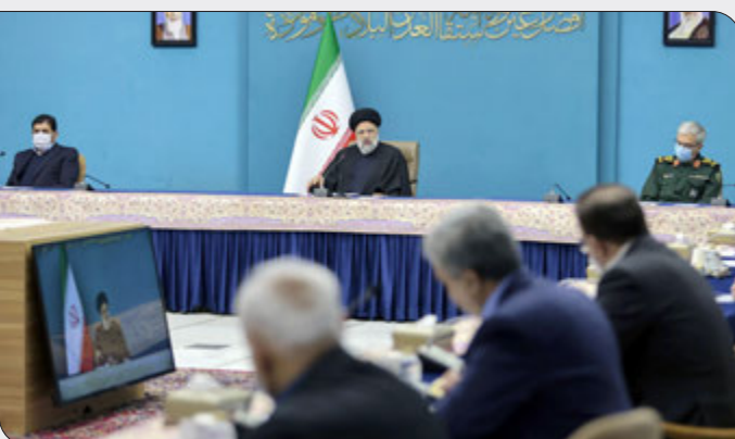
رئیس‌جمهور با تأکید بر لزوم اجرای دقیق طرح‌های پیشگیری هوشمند از سوی مراقبت‌های بهداشتی را بالاتر ببریم.