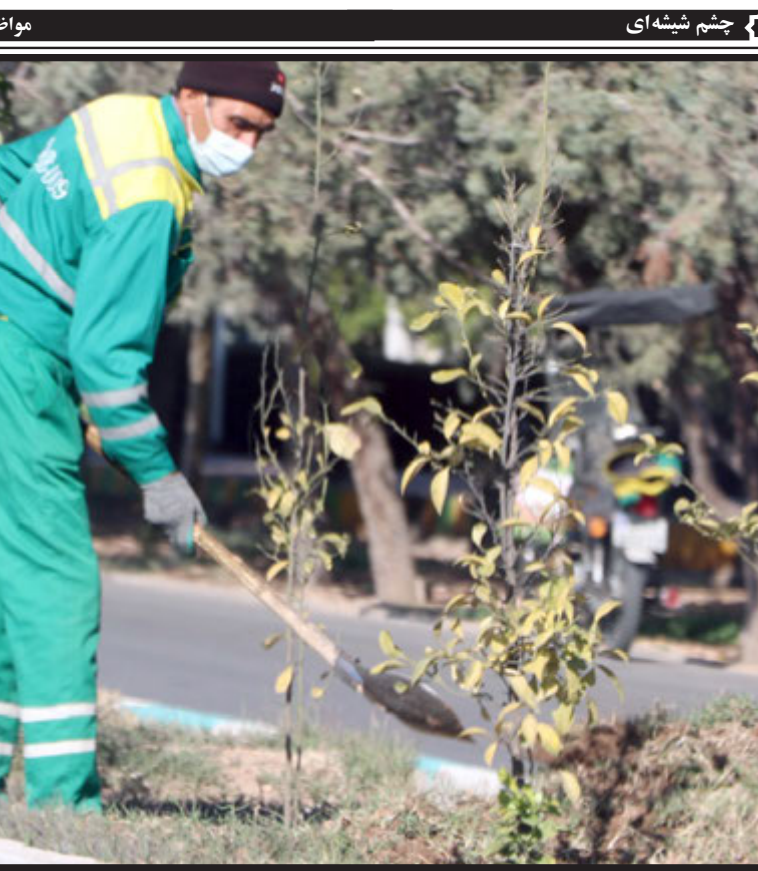
چشم شیشه ای