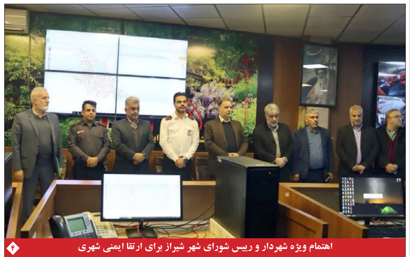
اهتمام ویژه شهردار و رئیس شورای شهر شیراز برای ارتقا ایمنی شهری

حجم محتوا درباره مهسائینی ۳۲ برابر مجموع اعتراضات گذشته به گزارش ایرنا این پژوهش نشان می‌دهد حجم محتوای توییتری درباره مهسائینی ۳۲ برابر مجموع اعتراضات گذشته بوده است. همچنین نتایج این داده‌کاوی از قرار گرفتن سه رسانه ایران اینترنشنال، ایرنا و بی‌بی‌سی فارسی در صدر مراجع خبری پرنفوذ حکایت دارد. در گزارش شرکت داده‌کاوی دیتاک در مورد مرگ مهسائینی در فضای مجازی در بستریهای مختلف در بازه زمانی ۲۳ شهریور تا ۲ مهرماه، محورهای اصلی مراجع احساس و گرایش سیاسی کاربران و رسانه‌ها مورد توجه قرار گرفته است. محور، درون‌مایه اصلی پیام را مشخص می‌کند؛ مرجع محتوا نشان می‌دهد پیام به چه کسی یا چه چیزی ارجاع دارد؛ گرایش سیاسی، وابستگی و تعلق سیاسی پیام‌گذار یا رسانه را بازتاب می‌دهد؛ در نهایت احساس، رویکرد احساسی پیام یا حاملان پیام را مشخص می‌کند.