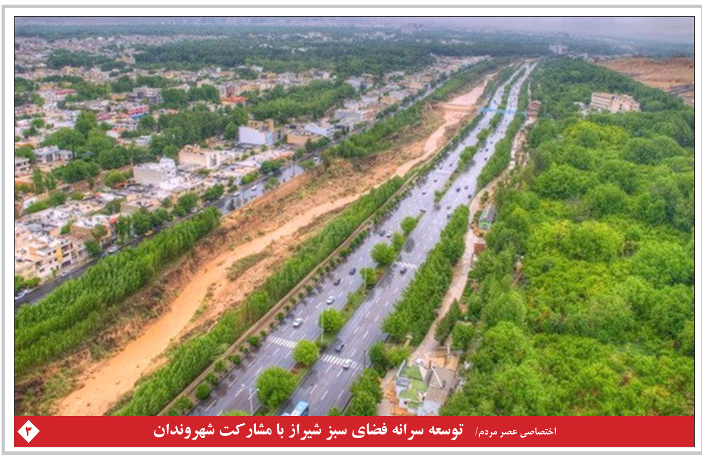
اختصاصی عصر مردم / توسعه سرانه فضای سبز شیراز با مشارکت شهروندان

امیرعبداللهیان در نشست خبری با مقدار خبر داد دعوت مجدد بشار اسد از رئیس جمهور ایران برای سفر به سوریه