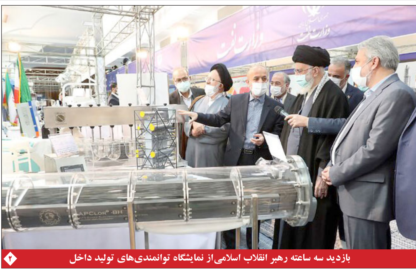
بازدید سه ساعته رهبر انقلاب اسلامی از نمایشگاه توانمندی‌های تولید داخل