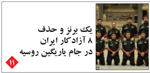
یک برنز و حذف ۸ آزادکار ایران در جام یاریگین روسیه