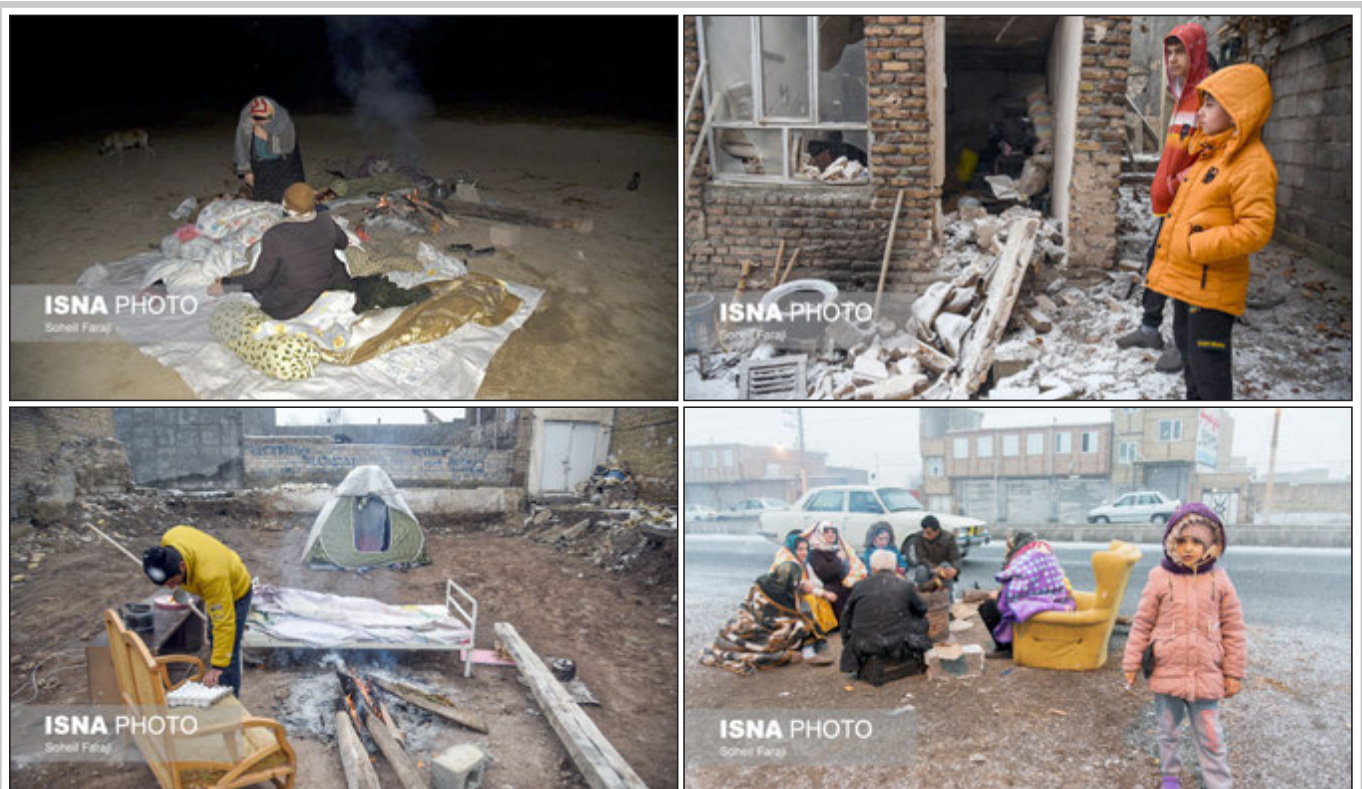
۳ فوتی و ۸۱۶ مصدوم در زلزله خوی

وزیر خارجه قطر: پیام آمریکا را به ایران منتقل کردیم ایسنا نوشت: وزیر امور خارجه قطر گفت: همه طرف‌های مذاکرات رفع تحریم‌ها را تشویق می‌کنیم به توافق برگردند. شیخ محمد بن عبدالرحمن آل ثانی وزیر امور خارجه قطر در نشست مطبوعاتی مشترک با وزیر خارجه ایران با ابراز خرسندی از حضور در تهران و انجام گفت‌وگو و رایزنی با مقامات ایران، گفت: در دیدار امروز با آقای امیر عبداللهیان بر اهمیت گسترش همکاری‌های تجاری و اقتصادی دو کشور تاکید کردیم، فرصت خوبی بود که در ارتباط با گفت‌وگوهای منطقه‌ای و تحولات بین‌المللی رایزنی و گفت‌وگو کنیم.