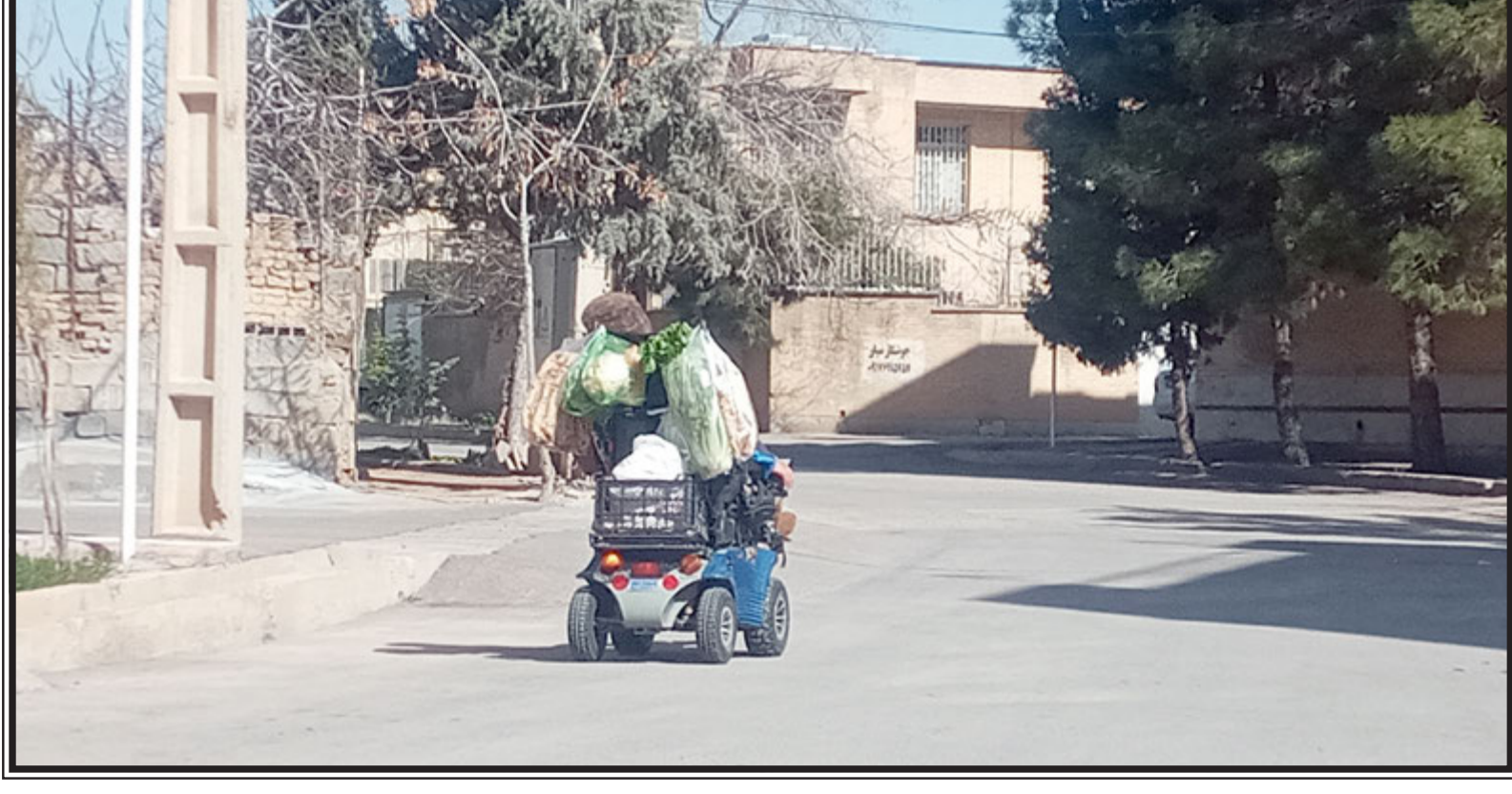
معلولیت پایان راه نیست