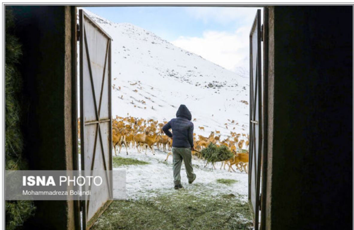
ISNA PHOTO Mohammadreza Bolandi