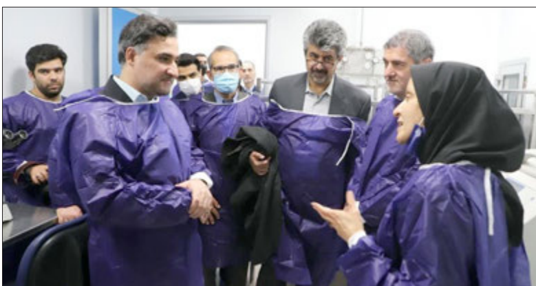
پزشکی و داروسازی گفته می‌شود که در محصولاتی نظیر دارو، مواد غذایی و محصولات آرایشی بهداشتی کاربرد دارد که می‌بایست بدون هرگونه ذرات آلاینده تولید شوند.

مرضیه باقی پور معاون علمی، فناوری و اقتصاد دانش بنیان ریاست جمهوری حمایت‌های خود را منوط به مدل اقتصادی مناسب دانست و بر توسعه فناوری‌های کاربردی تاکید کرد.