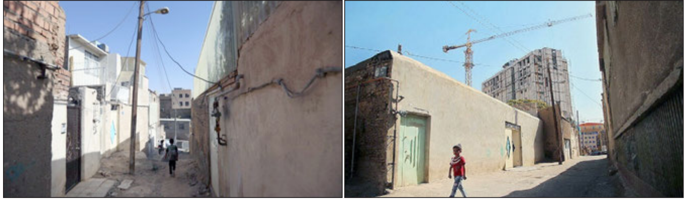
نوسازی بافت های فرسوده راهکاری برای تحقق تولید مسکن