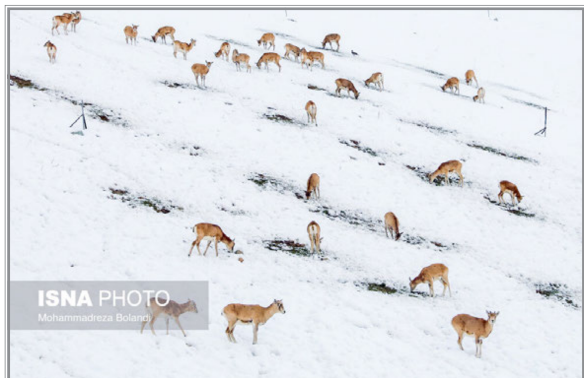
ISNA PHOTO Mohammadreza Bolandi