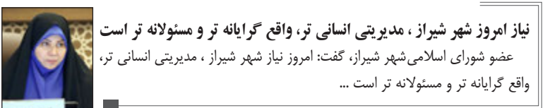
نیاز امروز شهر شیراز، مدیریتی انسانی تر، واقع گرایانه تر و مسئولانه تر است عضو شورای اسلامی شهر شیراز، گفت: امروز نیاز شهر شیراز، مدیریتی انسانی تر، واقع گرایانه تر و مسئولانه تر است ...