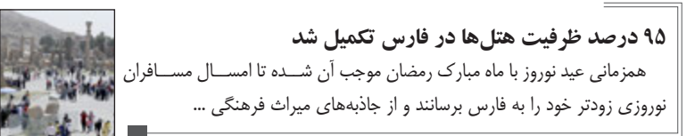
۹۵ درصد ظرفیت هتل‌ها در فارس تکمیل شد همزمانی عید نوروز با ماه مبارک رمضان موجب آن شده تا امسال مسافران نوروزی زودتر خود را به فارس برسانند و از جاذبه‌های میراث فرهنگی ...

ایرنا: همزمانی عید نوروز با ماه مبارک رمضان موجب آن شده تا امسال مسافران نوروزی زودتر خود را به فارس برسانند و از جاذبه‌های میراث فرهنگی، گردشگری و مذهبی استان دیدن کنند.