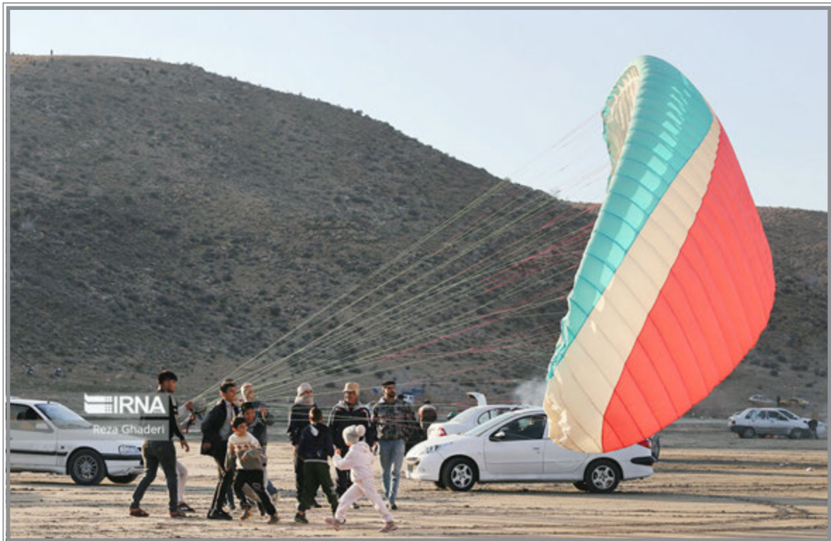
بهار زودهنگام مهارلو