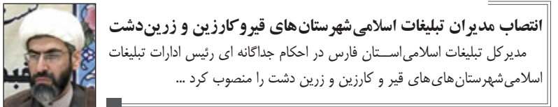
انتصاب مدیران تبلیغات اسلامی شهرستان‌های قزوین و کارزین و زرین‌دشت مدیرکل تبلیغات اسلامی استان فارس در احکام جداگانه ای رئیس ادارات تبلیغات اسلامی شهرستان‌های قزوین و کارزین و زرین دشت را منصوب کرد ...