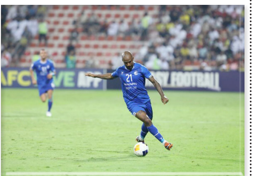
پیشکسوت استقلال گفت: استقلال در نیمه اول از نظر دفاعی عالی بازی کرد، اما در دفاع وسط هونز کند است و بازیکنان هماهنگ نیستند.