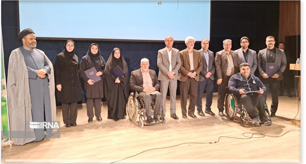
ایرنا: قهرمانان توان یاب و جانباز استان فارس در مسابقات پارالمپیک ۲۰۲۴ پاریس و رقابت های بین المللی و کشوری طی مراسمی مورد تجلیل قرار گرفتند.

به گزارش خبرنگار ایرنا در این مراسم که دیروز چهارشنبه در سالن