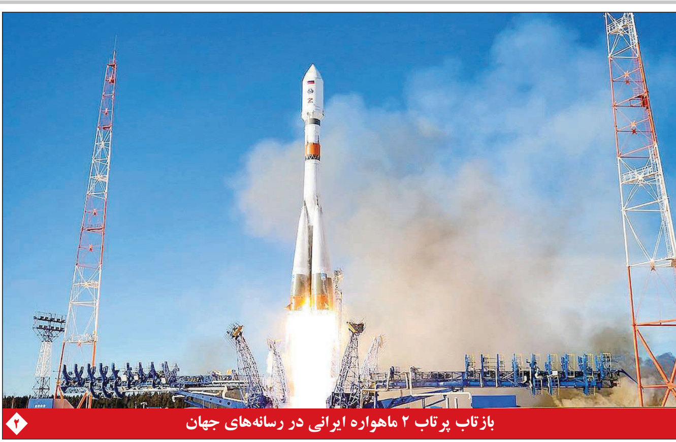
بازتاب پرتاب ۲ ماهواره ایرانی در رسانه‌های جهان

مدیر کل فرهنگ و ارشاد اسلامی استان فارس: هنر نمایش فارس طی ۲ سال ۱۰ جایزه ملی را از آن خود کرده است