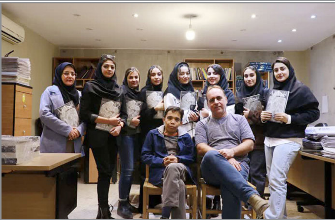
چشم شیشه ای