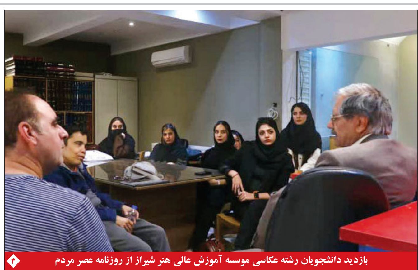
بازدید دانشجویان رشته عکاسی موسسه آموزش عالی هنر شیراز از روزنامه عصر مردم

استاندار فارس در جلسه ستاد هماهنگی و پیگیری مناسب سازی استان تاکید کرد: مدیران در جلسات حضور فعال داشته باشند