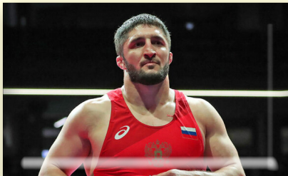
وزن ۹۷ کیلوگرم، عازم رقابت‌های کشتی آزاد قهرمانی اروپا در اسلواکی خواهد شد.

تیم ملی کشتی آزاد روسیه قرار است امروز شنبه با ترکیب کامل عازم اسلواکی شود. سعدالله‌یف سال گذشته نیز به همین دلیل نتوانست در رقابت‌های قهرمانی اروپا به میزبانی رومانی حاضر شود. او به دلیل حمایت‌های گذشته خود از حمله نظامی روسیه به اوکراین با محرومیت‌های شدیدتری از سوی کشورهای اروپایی نسبت به دیگر کشتی‌گیران روسیه مواجه شد. رقابت‌های کشتی آزاد قهرمانی اروپا از روز دوشنبه به میزبانی براتیسلاوا پایتخت اسلواکی آغاز می‌شود.