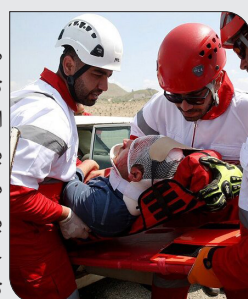
مدیرعامل جمعیت هلال‌احمر فارس گفت: در طرح ملی خدمات نوروزی ۱۴۰۴، این نهاد با بهره‌گیری از تمامی ظرفیت‌های انسانی و لجستیکی خود، موفق به ارائه خدمات متنوع امدادی، آموزشی، درمانی و حمایتی به بیش از یک میلیون و ۷۲۰ هزار نفر از هموطنان در سراسر استان شد.