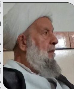
آیت‌الله بزرگ بنیادی امام جمعه اسبق کازرون در سن ۸۳سالگی به علت بیماری در بیمارستان ولی عصر (عج) این شهرستان درگذشت.

پس از آن امامت مسجد جامع مدرسه و تدریس در حوزه علمیه کازرون را به عهده داشت. و سرانجام در هفدهم فروردین ماه ۱۴۰۴ درگذشت.