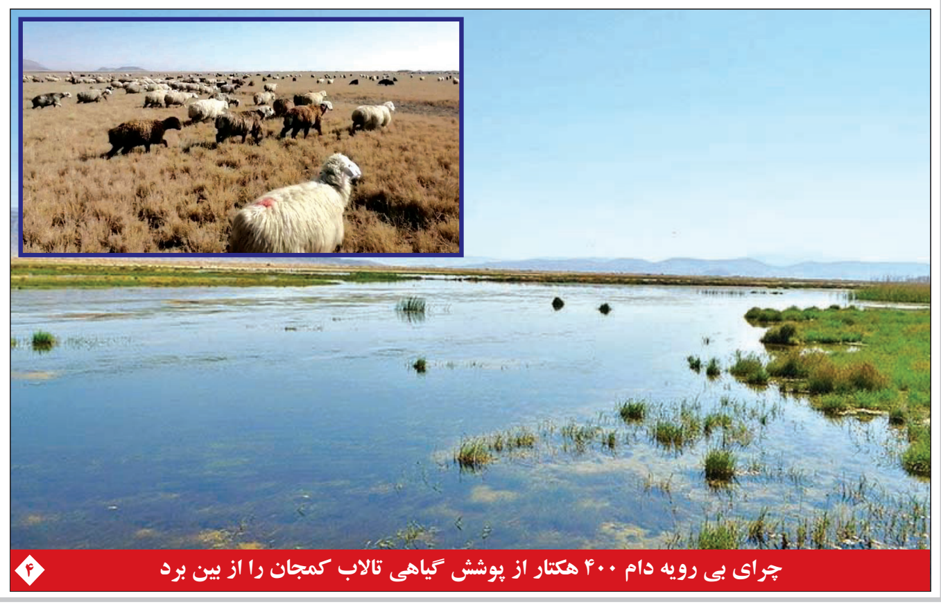
جرای بی رویه دام ۴۰۰ هکتار از پوشش گیاهی تالاب کمجان را از بین برد