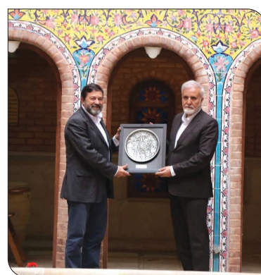
شهردار شیراز با مدیر ارشد اجرایی انجمن شهرداری‌های برزیل ملاقات کرد.

شهردار شیراز با مدیر ارشد اجرایی انجمن شهرداری‌های برزیل ملاقات کرد. در این دیدار دوجانبه همچنین بر آمادگی شهرداری برای معرفی شیراز به شهروندان برزیلی و فناوری ریاست‌جمهوری امضا شده است. عضو هیئت‌مدیره متروپلیس (انجمن کلان‌شهرهای جهان) در این دیدار دوجانبه همچنین بر آمادگی شهرداری برای معرفی شیراز به شهروندان برزیلی و فناوری ریاست‌جمهوری امضا شده است. عضو هیئت‌مدیره متروپلیس (انجمن کلان‌شهرهای جهان) در این دیدار دوجانبه همچنین بر آمادگی شهرداری برای معرفی شیراز به شهروندان برزیلی و فناوری ریاست‌جمهوری امضا شده است.