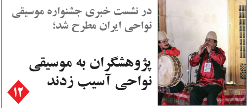
در نشست خبری جشنواره موسیقی نواحی ایران مطرح شد؛