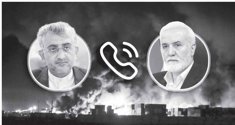
تماس تلفنی برقرار و ضمن ابراز همدردی و تسلیت به مناسبت درگذشت تعدادی از

هموطنان، آمادگی کامل شهرداری این کلان‌شهر را برای ارسال فوری امکانات و تجهیزات برای اطفای حریق و امدادرسانی به آسیب‌دیدگان اعلام کرد. سکان‌دار مدیریت شهری شیراز در این تماس تلفنی با بیان اینکه در غم از دست دادن هموطنان عزیز شریک هستیم، تاکید کرد که مردم این کلان‌شهر در این لحظات دشوار در کنار مردم بندرعباس هستند و شهرداری شیراز آماده است با تمام ظرفیت خود در خدمت‌رسانی به آسیب‌دیدگان این حادثه تلخ همکاری کند.