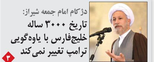
دژ کام امام جمعه شیراز: تاریخ ۳۰۰۰ ساله خلیج فارس با یاهو گوئی ترامپ تغییر نمی‌کند