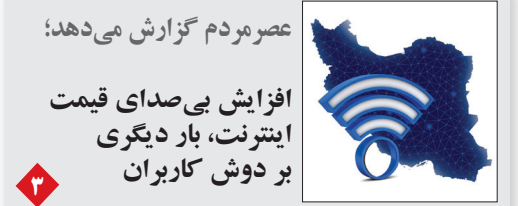
عصر مردم گزارش می‌دهد؛ افزایش بی صدای قیمت اینترنت، بار دیگری بر دوش کاربران