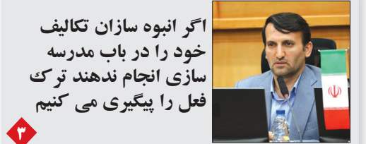
اگر انبوه سازان تکالیف خود را در باب مدرسه سازی انجام ندهند ترک فعل را پیگیری می‌کنیم

در هفتمین پیش نشست همایش بین المللی زنان، قدرت و مدیریت سیاسی ایران در شیراز مطرح شد: