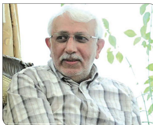
وی با غنی‌شده برای نیروگاه هسته‌ای آینده خود وارد کند. ایران فاقد منابع کافی برای تولید اورانیوم مورد نیاز در برق هسته‌ای است. بنابراین، از نظر اقتصادی ممکن است تأثیر چندانی نداشته باشد، اما از نظر حیثیتی، سال‌ها روی این قضیه تأکید شده و اهمیت ویژه‌ای پیدا کرده است.

روسیه و چین و کشورهای منطقه، می‌توان گفت که سیاست خارجی ایران در توافق روی برنامه هسته‌ای و مذاکرات هسته‌ای به تهنیتی برای رفع تحریم‌ها کافی نیست سفر سابق ایران در مالزی در خصوص امکان پیشبرد توافق میان ایران و آمریکا به شکل گام به گام و توافق مرحله‌ای، تاکید کرد: تحریم‌های ایران به چند دسته تقسیم می‌شود، تحریم‌های هسته‌ای کلیدی‌ترین و حساس‌ترین موضوع اختلافات ایران و آمریکا هستند. اما تمام تحریم‌ها، تحریم‌های هسته‌ای نیستند و شامل تحریم‌هایی هستند که مربوط به مسائل موشکی، اوکراین، سیاست خاورمیانه و مسائل حقوق بشر هم می‌شوند. تمام این تحریم‌ها هم توسط رئیس‌جمهور آمریکا برقرار نشده و تحریم‌هایی هستند که کشور آن‌ها را تصویب کرده و دوجزبی هستند. بنابراین، اگر توافقی در خصوص برنامه هسته‌ای به عنوان گام اول صورت گیرد و به مذاکرات ادامه داده شود و در سایر موضوعات هم طرفین به توافق برسند، آن‌گاه می‌توانیم شاهد برداشتن کلیه تحریم‌ها از سوی آمریکا باشیم. در غیر این صورت، به نظر می‌رسد که مشکل باقی خواهد ماند. به عبارت دیگر، حل مشکل توافق بودند توافق برجام، توافق اوپاوا یا ایران است. این بار، توافق آمریکا با ایران خواهد بود و طبیعتاً از تضمین بیشتری برای پایداری برخوردار خواهد بود.