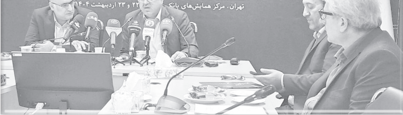
تهران، مرکز همایش‌های بانکی ۲۲ و ۲۳ اردیبهشت ۱۴۰۴