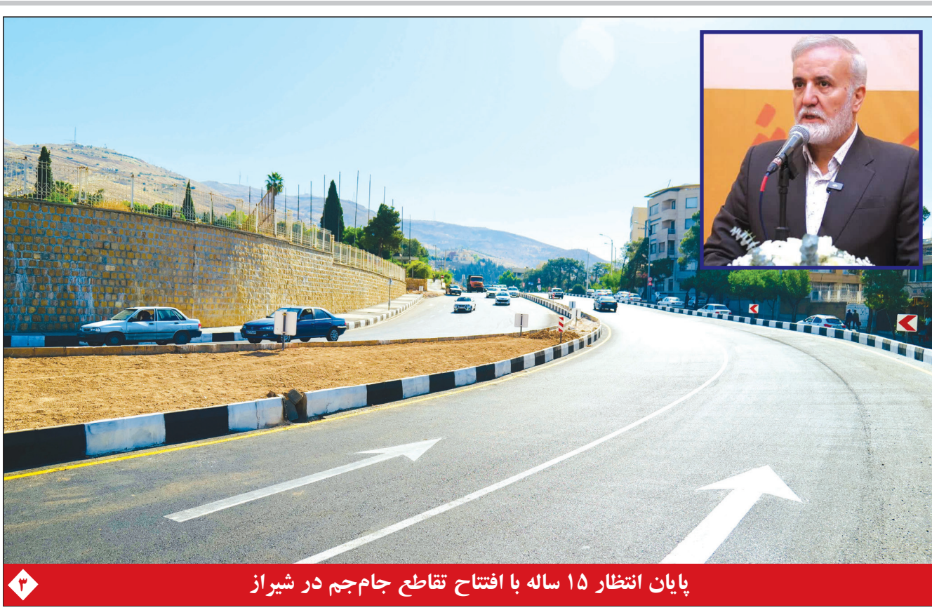
پایان انتظار ۱۵ ساله با افتتاح تقاطع جام‌جم در شیراز

سالاری خاطر نشان کرد: در طرح مذکور تا ۱۴ سکه می‌تواند ماهیت کیفری داشته باشد و بیشتر از آن جنبه مدنی و حقوقی دارد. به این مفهوم که اگر ۱۰۰۰ سکه هم به عنوان مهریه تعیین شود، زوج می‌تواند آن را به اجرا بگذارد و اگر مال، املاک یا پولی از مرد شناسایی کرد، معرفی کند و اجرای احکام آن را توقیف کند و مهری را به زن پرداخت کند.