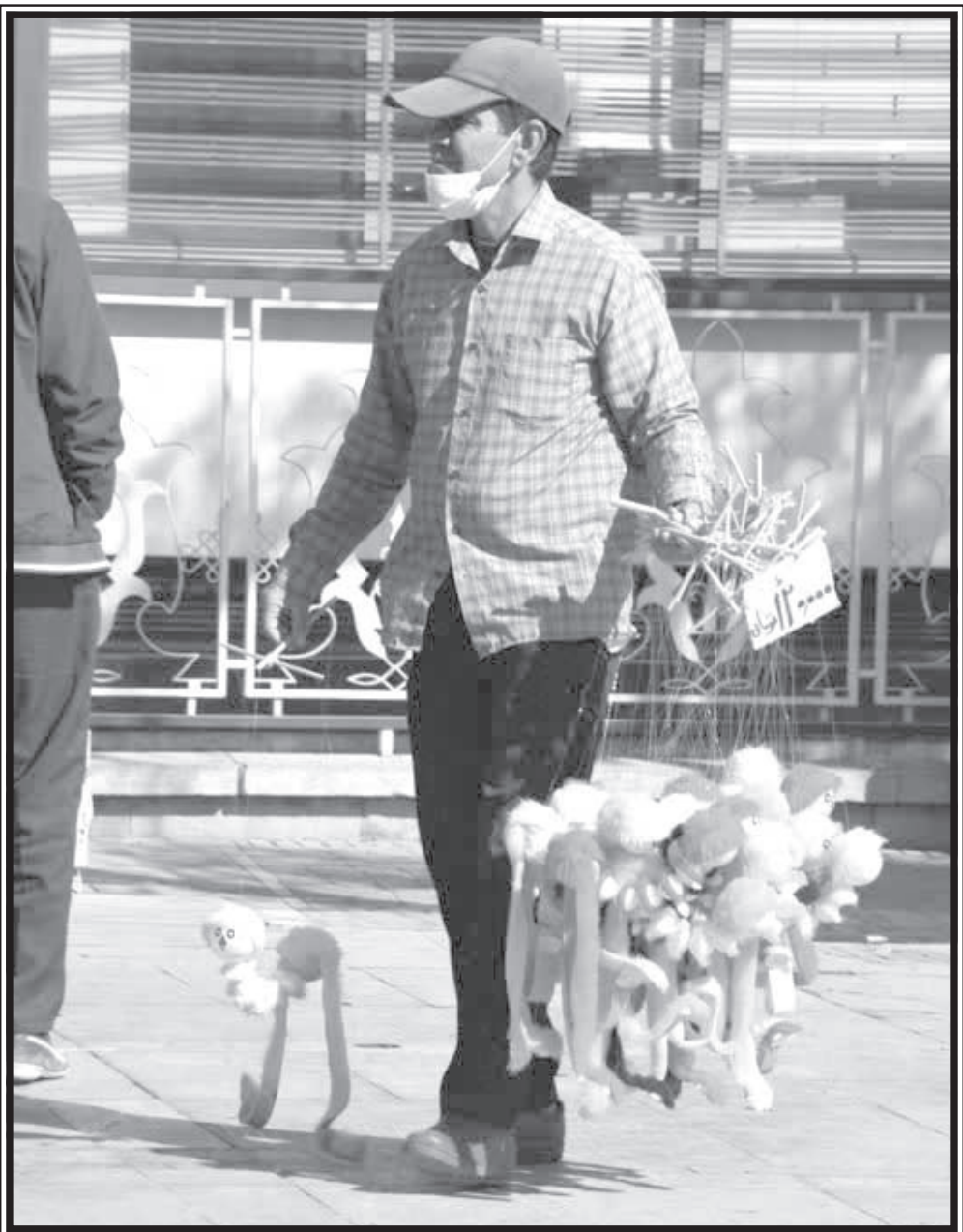
چشم شیشه ای