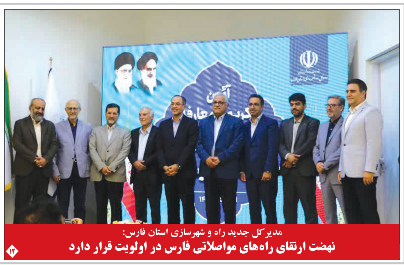
مدیر کل جدید راه و شهرسازی استان فارس: نهضت ارتقای راه‌های مواصلاتی فارس در اولویت قرار دارد