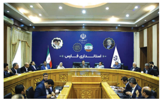
تقدیر معاون علمی رییس جمهور از شهردار شیراز

در دیدار استاندار فارس با امام جمعه شیراز مطرح شد: