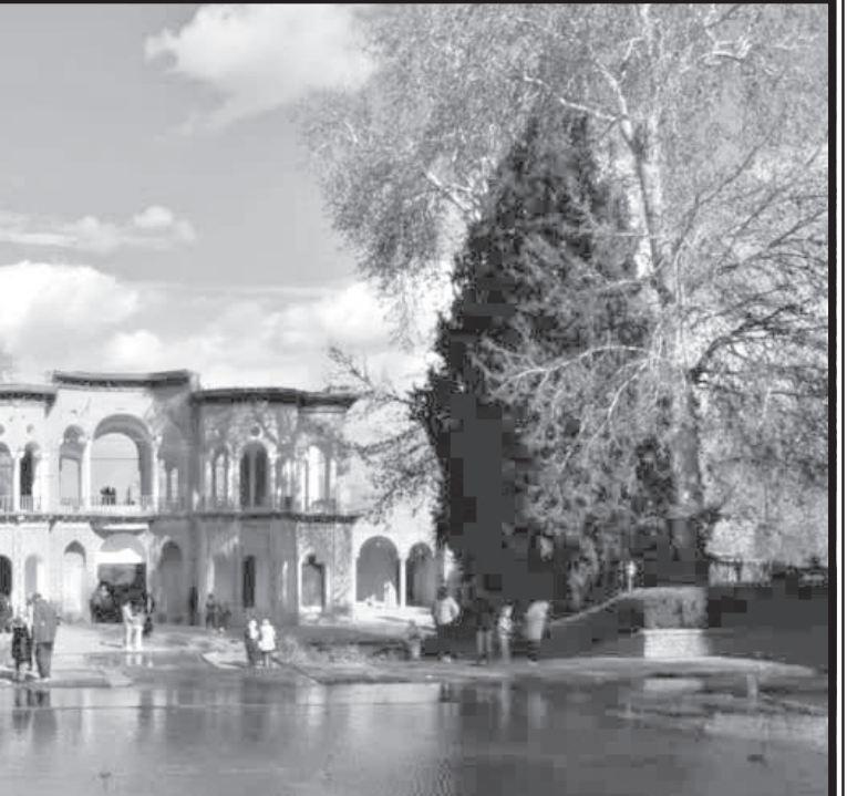
عکس: باغ شاهزاده کرمان