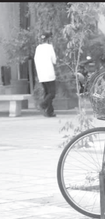
عکس: در شهر