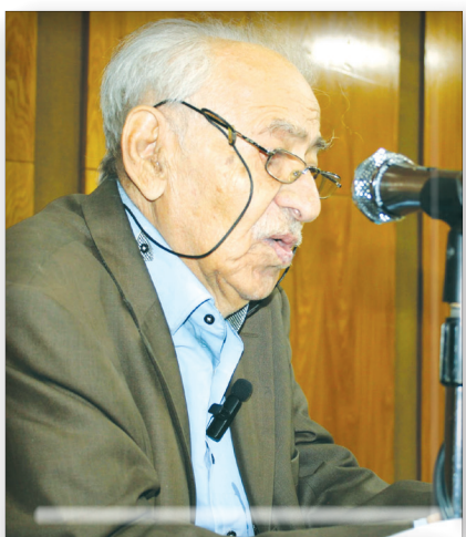
حالت ذوق کشی دارد.

مؤلف کتاب در دست انتشار «سعدی کاشف زیبایی» تصریح کرد: جوانان به دلایل مختلف مسائل دنیای جدید و با ورود به دانشگاه‌ها رغبت‌شان را نسبت به خواندن کتاب از دست می‌دهند. دانشگاه‌های ادبیات ما ذهن دانشجویان ادبیات را با پیش ادبی آشنا نمی‌کنند بلکه اشعاری از حنظله بادغیسی و رودکی و دیگر کلاسیک‌پردازان را در ذهن آنان فرو می‌کنند. دانشکده‌ها و دبیرستان‌ها به طور کلی علم زندگی و علم زمان را به جوانان یاد نمی‌دهند. دیگر نه معلم‌ان با علاقه مثل قدیم وجود دارد و نه دانش‌پژوه خوب و نه برنامه درسی مناسب. اکثر برنامه‌های درسی