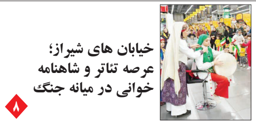
خیابان های شیراز؛ عرصه تئاتر و شاهنامه خوانی در میانه جنگ