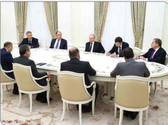
هیچ اساسی ندارد. پوتین با بیان اینکه «روابط ما با ایران، سوابق طولانی و خوبی دارد» گفت: از طرف خودمان، تلاش می‌کنیم

به مردم ایران کمک کنیم. رئیس‌جمهور روسیه با اشاره به رایزنی‌های خود در طول مدت اخیر گفت: من یک سری گفت‌وگوهای تلفنی با رئیس‌جمهور آمریکا، نخست‌وزیر اسرائیل، رئیس امارات و همچنین رئیس‌جمهور ایران داشتم. شما هم گفت‌وگوهایی با اروپایی‌ها در روزهای اخیر داشتید. پوتین همچنین گفت: خیلی خوشحال هستم که شما امروز در مسکو هستید. این امر به ما فرصتی می‌دهد که بتوانیم بررسی کنیم که چگونه می‌شود یک راه‌حلی پیدا شود و با هم این کار را انجام می‌دهیم. او در پایان گفت: موجب امتنان خواهد بود که بهترین آرزوها را خدمت مقام معظم رهبری و رئیس‌جمهور ایران برسانید.