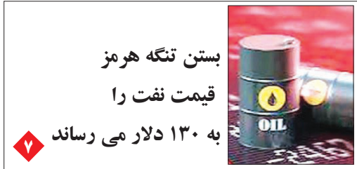
بستن تنگه هرمز قیمت نفت را به ۱۳۰ دلار می رساند