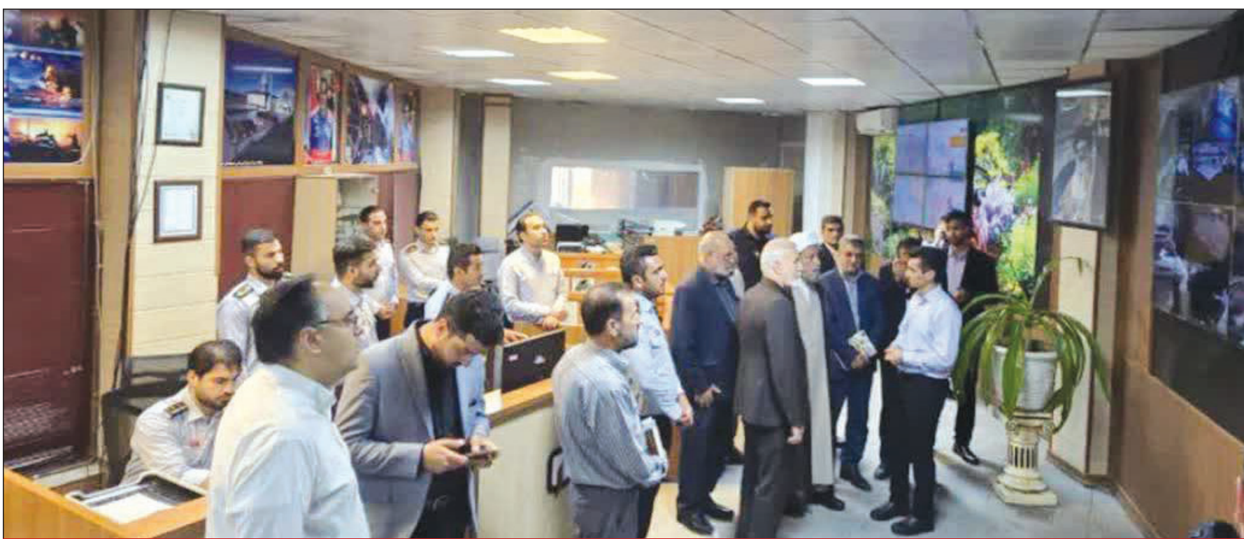
حضور امام جمعه شیراز در ستاد فرماندهی ۱۲۵ شهرداری