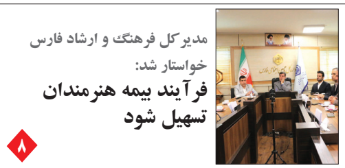
مدیر کل فرهنگ و ارشاد فارس خواستار شد: فرآیند بیمه هنرمندان تسهیل شود