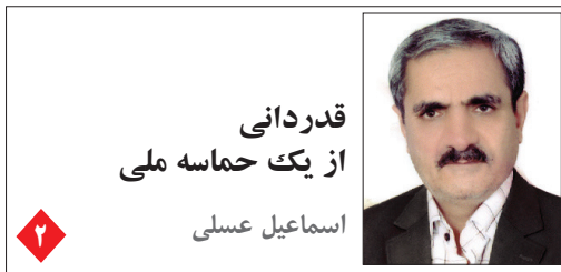
قدردانی از یک حماسه ملی اسماعیل عسلی

به دنبال تحمیل آتش بس به رژیم صهیونیستی صورت گرفت؛