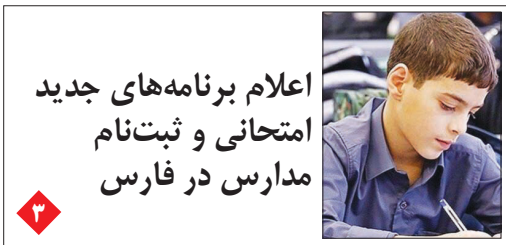
اعلام برنامه‌های جدید امتحانی و ثبت‌نام مدارس در فارس