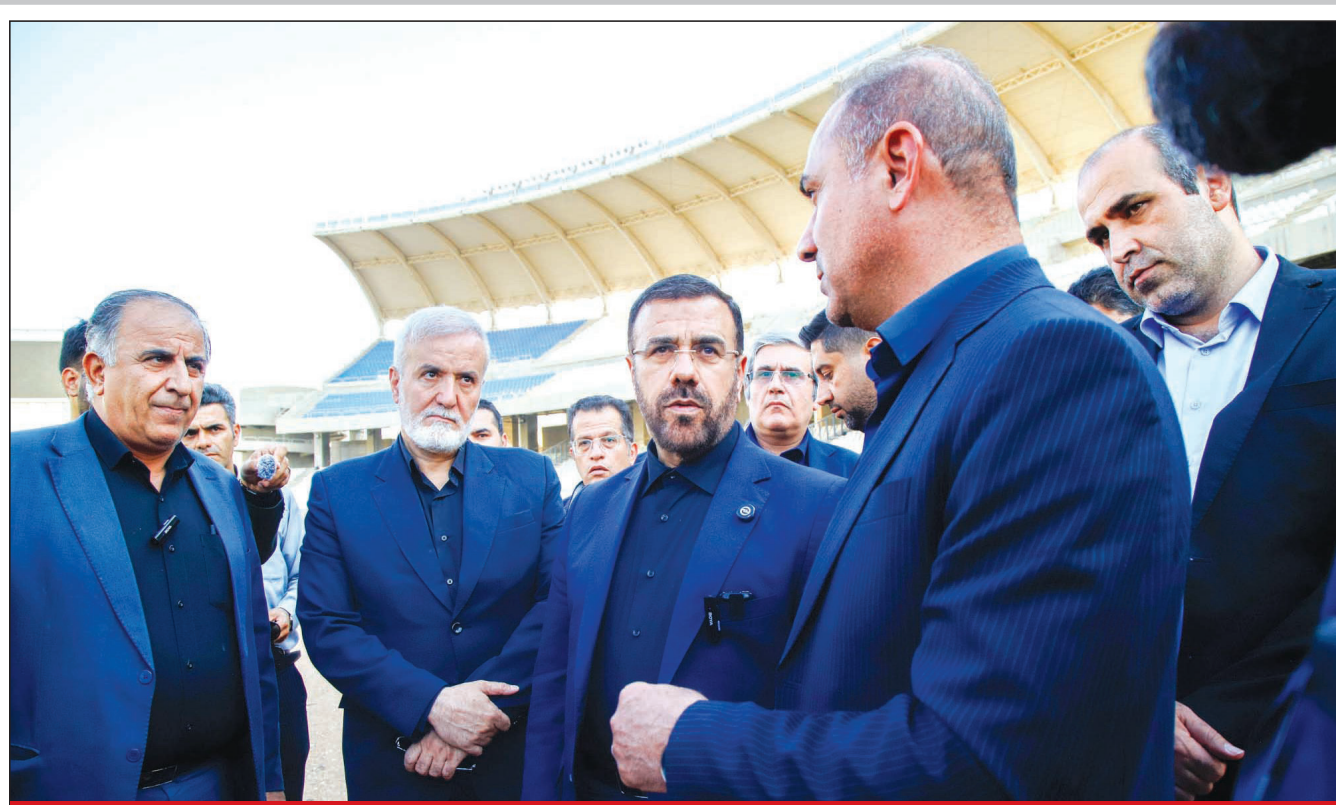
استاندار فارس: معطل ماندن ورزشگاه پارس توجیه ندارد

استاندار فارس تاکید کرد: لزوم مقاوم‌سازی ساختمان‌های عمومی و ضرورت شناسایی سازه‌های ناایمن