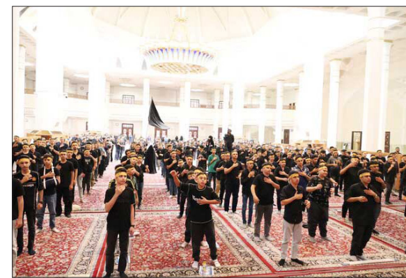
فرهنگ عاشورا تأکید کردند. مدیرکل آموزش و پرورش فارس حسین» بار دیگر بر پیوند نسلی با

در ششمین روز از ماه محرم‌الحرام، آیین سوگواره سراسری «احلی من العسل» با حضور بیش از ۲۶ هزار دانش‌آموز چهارشنبه، ۱۱ تیر در سراسر استان فارس برگزار شد. این برنامه معنوی هم‌زمان در بقاع متبرکه، مساجد و حسینیه‌های سراسر استان فارس و در شهر شیراز در حرم مطهر حضرت احمدین موسی شاهچراغ (ع) برگزار شد.