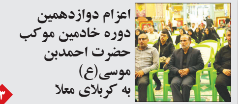
اعزام دوازدهمین دوره خادمین موبک حضرت احمد بن موسی (ع) به کربلا معلی