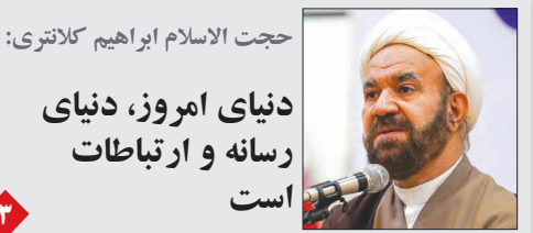
حجت الاسلام ابراهیم کلاتوری: دنیای امروز، دنیای رسانه و ارتباطات است