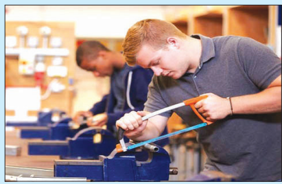
گزارش اختصاصی عصر مردم؛ مهارت آموزی در تنگنا؛ فشار تعرفه ها بر آموزشگاه های فنی و حرفه ای