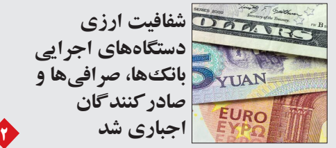
شفافیت ارزی دستگاه های اجرایی بانک ها، صرافی ها و صادر کنندگان اجباری شد