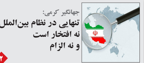
جهانگیر کریمی: تنهایی در نظام بین الملل نه افتخار است و نه الزام