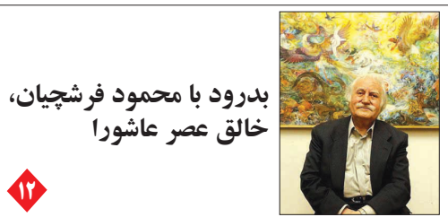
بدرود با محمود فرشچیان، خالق عصر عاشورا