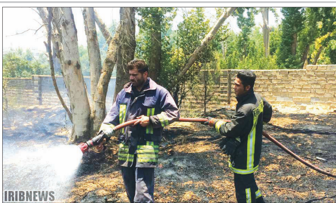
ریه‌های تنفسی شیراز زیر سایه آتش و تهدید