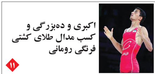
اکبری و ده‌بزرگی و کسب مدال طلای کشتی فرنگی رومانی