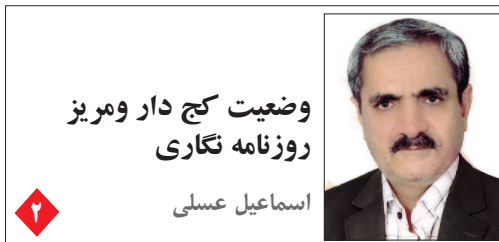
وضعیت کج دار و مریز روزنامه نگاری