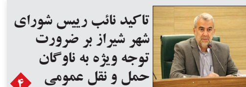
تاکید نائب رئیس شورای شهر شیراز بر ضرورت توجه ویژه به ناوگان حمل و نقل عمومی