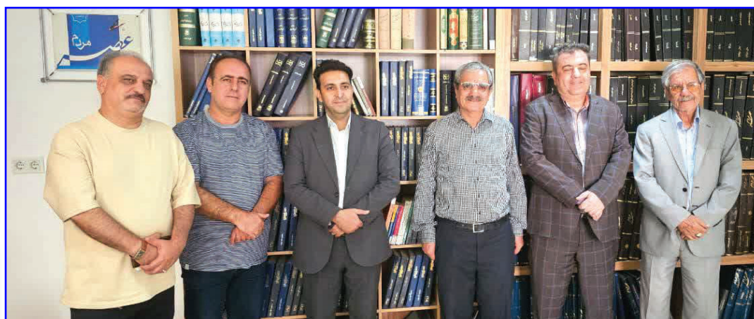
نشست صمیمی معاون دانشگاه علوم پزشکی شیراز با مدیر مسئول و هیات تحریریه روزنامه عصر مردم