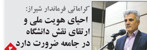
کرامتی فرماندار شیراز: احیای هویت ملی و ارتقای نقش دانشگاه در جامعه ضرورت دارد

با ساخت پارک بزرگ آبی، شیراز به قطب گردشگری تبدیل می شود