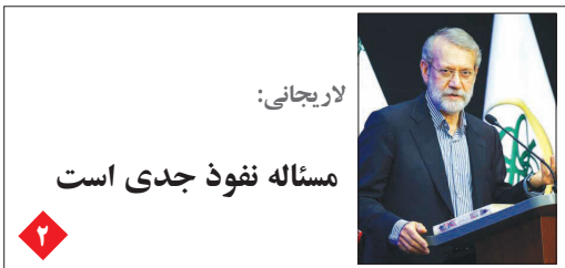
لاریجانی: مسئله نفوذ جدی است