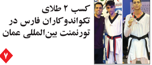
کسب ۲ طلای تکواندو کاران فارس در تورنمنت بین المللی عمان