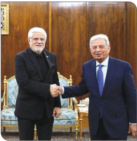
تا تحت تأثیر برخی مسائل جزئی قرار نگیرد. معاون اول رئیس‌جمهور بر ضرورت اتحاد میان کشورها و امت اسلامی به ویژه کشورهای تأثیرگذار دنیای اسلام تأکید کرد و افزود: امروز رژیم صهیونیستی در غزه به عنوان بخشی از خاک اسلامی مرتکب جنایات وحشیانه می‌شود و ما به دنبال قدرت دنیای اسلام

معاون اول رئیس‌جمهور با استقبال از تشکیل کمیته مشترک کشاورزی بین جمهوری اسلامی ایران و پاکستان تصریح کرد: آمادگی داریم در فناوری‌های پیشرفته به ویژه هوش مصنوعی و سایر فناوری‌های پیشرفته همکاری‌های دو جانبه و منطقه‌ای داشته باشیم و باید کمیسیون مشترک همکاری‌های اقتصادی نیز بیش از گذشته فعال شود و راهبردهای توافق شده عملیاتی شود تا شاهد تحولی بزرگ در روابط باشیم.