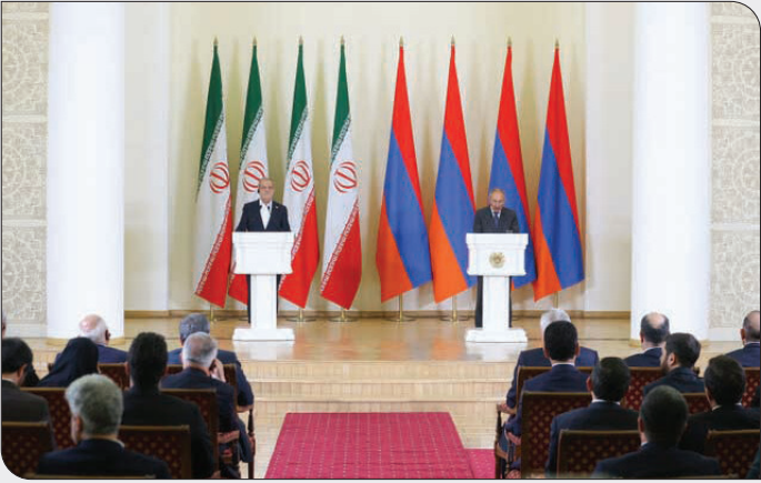
مردمان بوده است، گفت: از کوه‌های آزارات تا فلات ایران نسیم تاریخ، به سوی هر دو مرز برده است.

رئیس جمهور کشورمان در ادامه با بیان اینکه ایران، آرامش و رفاه همسایگان خود از جمله ارمنستان را هم‌راستا با منافع خود می‌داند، تصریح کرد: همکاری و توجه به مولفه‌های دوستی مهم‌ترین عامل پایداری امنیت و حرکت در مسیر توسعه‌یافتگی است. ایران با صراحت از تمامیت ارضی ارمنستان حمایت کرده و این سیاست ثابت و بدون تغییر ایران است.