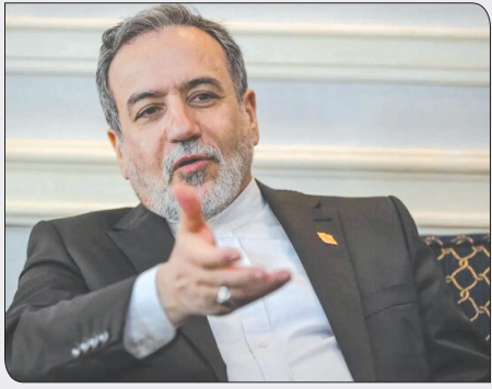
وزیر خارجه ایران با بیان این‌که «اروپا باید برای موفقیت دیپلماسی زمان و فضای لازم را ایجاد کند» تأکید کرد: همانطور

عراقچی با بیان این که «هفته گذشته، سه کشور اروپایی (بریتانیا، فرانسه و آلمان) اعلام کردند که فرآیند بازگرداندن