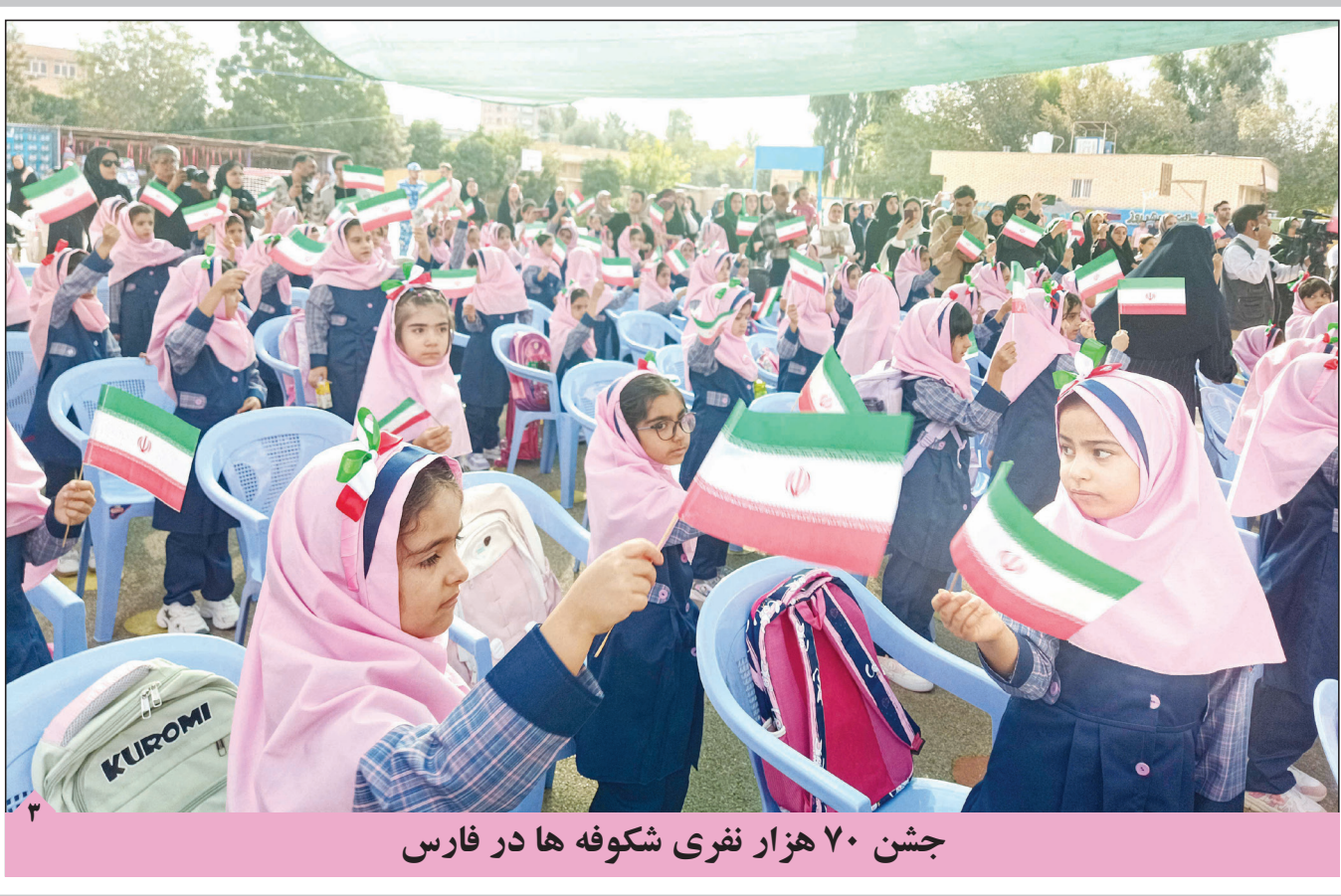
جشن ۷۰ هزار نفری شکوفه ها در فارس

۵۵ استاد دانشگاه شیراز در شمار پژوهشگران پراستناد ۲ درصد برتر جهان