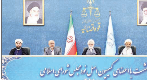
نشست با اعضای کمیسیون اصل نود مجلس شورای اسلامی