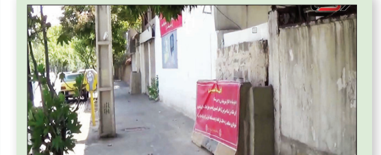
مهرتابان؛ آزمون قانون در شیراز