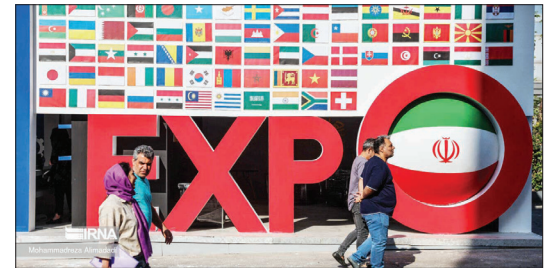
اکسپو؛ ویتترین جهانی ایران مقاوم و آینده نگر

رئیس مجلس: سه کشور اروپایی بانی اجرای اسنپ بک، واکنش ما را خواهند دید