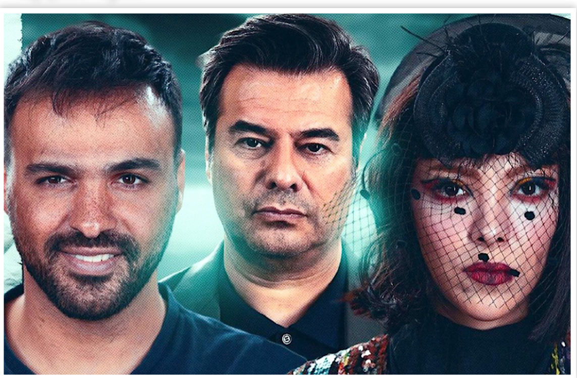
مجترب به ضرر و زیانهای برای جسم و روح کاربران دارد، از سوی دیگر

مزیت‌ها و محاسنی هم دارد. بطوریکه شبکه های مجازی باعث می‌شوند افراد با اشخاصی شبیه به خودشان آشنا شوند و دوستان زیادی در سراسر دنیا می‌توانند، پیدا کنند.