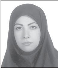
تویتر ... می‌پردازند.

جهان با ورود به عصر رسانه ها و دنیای مجازی، دروان جدیدی را آغاز کرده‌است. در دوران معاصر نسل کنونی جوامع از ابتدای حیاتش با رسانه ها بزرگ می‌شود و در دنیای اطلاعاتی و ارتباطی امروز این نسل بخش بزرگ، فرهنگ ارزش ها و هنجارهای جامعه خود و دیگر جوامع را از رسانه ها و دنیای مجازی دریافت می‌کند.