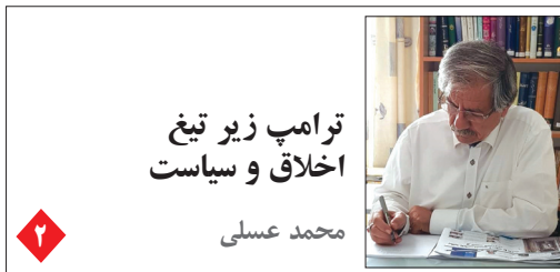
ترامپ زیر تیغ اخلاق و سیاست