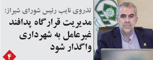
تدروی نایب رئیس شورای شیراز: مدیریت قرارگاه پدافند غیرعامل به شهرداری واگذار شود