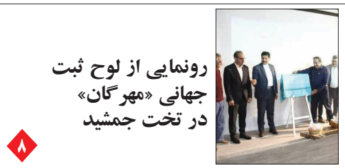
رونمایی از لوح ثبت جهانی «مهرگان» در تخت جمشید