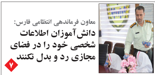
معاون فرماندهی انتظامی فارس: دانش آموزان اطلاعات شخصی خود را در فضای مجازی رد و بدل نکنند