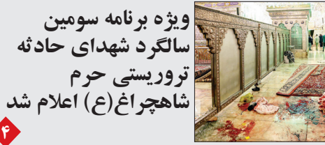
ویژه برنامه سومین سالگرد شهدای حادثه توریستی حرم شاهچراغ (ع) اعلام شد

رئیس‌جمهور با تأکید بر اینکه هر مقرراتی که موجب فشار اقتصادی بر زندگی مردم شود، با اصول عدالت و تدبیر مغایرت دارد و باید سریعاً اصلاح شود، گفت: در تأمین و تخصیص منابع مالی کشور، هیچ موضوعی نباید بر معیشت مردم تقدم و ترجیح یابد. کلیه تصمیمات، سیاست‌گذاری‌ها و اقدامات دولت در هر حوزه‌ای، باید تابع و فرع بر تلاش برای بهبود زندگی و رفاه عمومی جامعه باشد. به گزارش ایسنا، مسعود پزشکیان در جلسه هیئت دولت که عصر دیروز یکشنبه، ۲۷ مهر ۱۴۰۴ برگزار شد، با تأکید بر اهمیت موضوع معیشت مردم، آن را اولویت نخست و مهمتر از تمامی